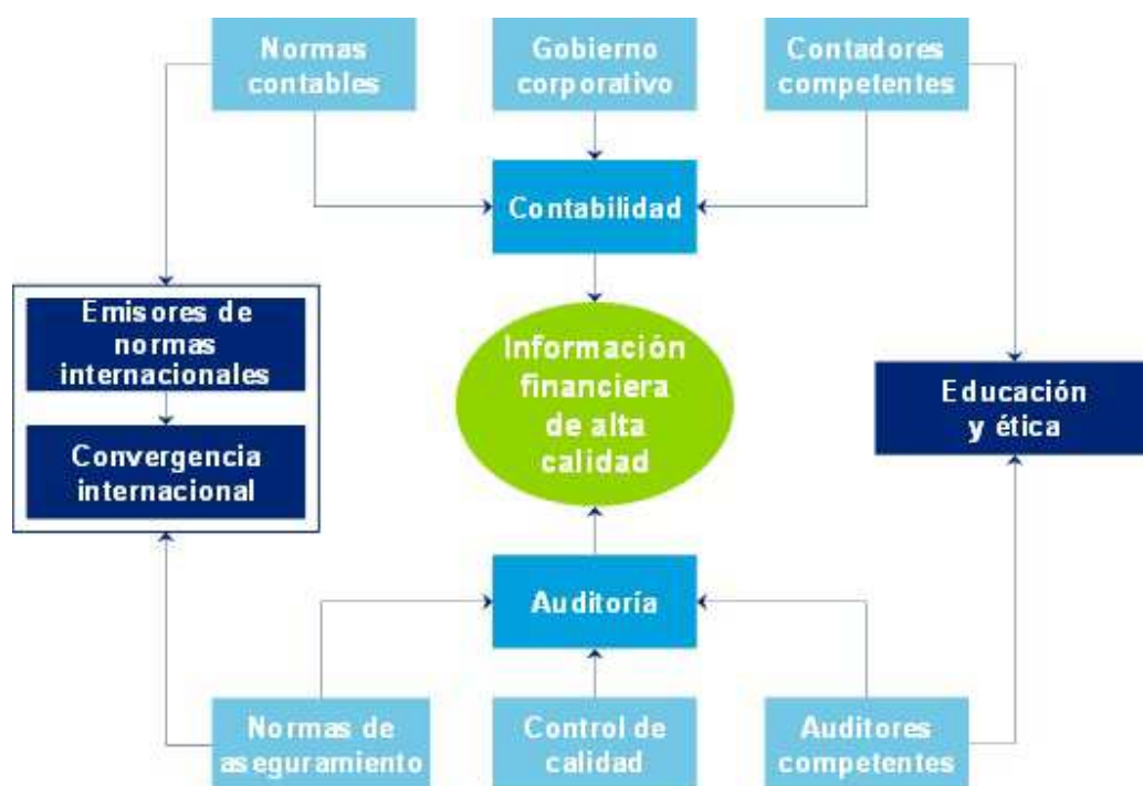
Figura 2 Información Financiera

Después de que el consejo de normas internacionales de contabilidad (IASBE) desarrolló y publicó en julio de 2009 las NIIF y NIC plenas y las NIIF para PYMES, proceso que empezó en el año 2001, viendo la necesidad de que la información financiera se leyera y entendiera en el mismo idioma a nivel mundial.