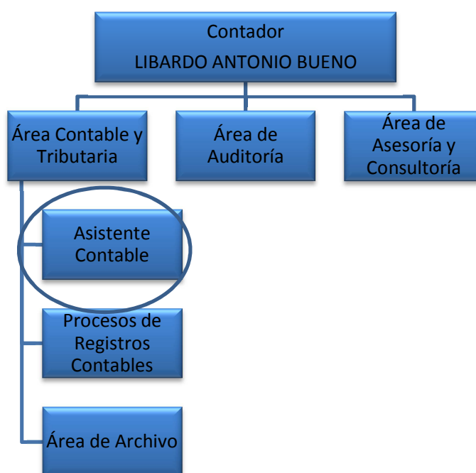
Figura 3 Organigrama de la Empresa LIBARDO ANTONIO BUENO BUSTAMANTE (fuente propia).