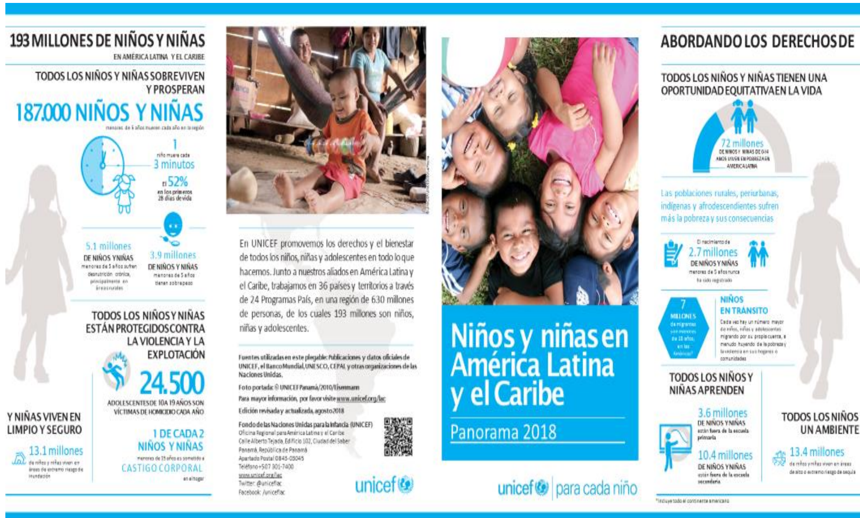
Figura 1. Niños y niñas en América Latina y el Caribe Panorama 2018. Tomado de 20180911_UNICEF-NNA-en-ALC-Panorama2018-ESP-web en https://www.unicef.org/lac/media/4926/file . Fuentes utilizadas: Publicaciones y datos oficiales de UNICEF, el Banco Mundial, UNESCO, CEPAL y otras organizaciones de las Naciones Unidas. (Fondo de las Naciones Unidas para la Infancia - UNICEF, 2018).