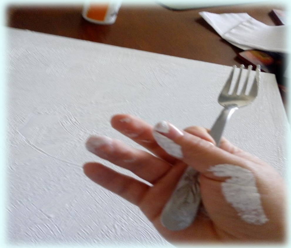
Ilustración 17. Utilización de instrumentos para texturización

#7 Días después quise mirar una textura para los lienzos que me hacían falta, me encontraba haciendo unos moldes en yeso para un cuadro y me sobra bastante yeso moldeable, entonces cogí un lienzo y busqué en diferentes lugares de mi casa una espátula pero jamás la encontré, entonces tenía unos palos de paleta y comencé a esparcir el yeso moldeable por el lienzo con los palos de paleta, me pareció chévere pero al final me di cuenta que habían quedado unos grumos muy gruesos pero quise dejarlo así porque quería ver cómo quedaba, este trabajo me relajo aunque para ser franca no me sentía mal sino estaba normal, pero me ayudó a relajarme un poco más, dejé secando el lienzo y me faltaba sólo un lienzo por hacerle una textura, me pareció genial lo que estaba ocurriendo al genera textura en los lienzos y cada una de ellas fue surgiendo en diferentes ocasiones, el último lienzo lo realice este mismo día, consistió en pintar la mano de mi mamá con gesso y empecé a ponerla en diferentes lugares del lienzo, conté con la ayuda de la enfermera de mi mamá para tomar fotos y mientras estaba haciendo este proceso mi mamá me dijo que se sentía chévere la sensación de tener el gesso en su mano pero a la vez me decía que tuviera mucho cuidado de