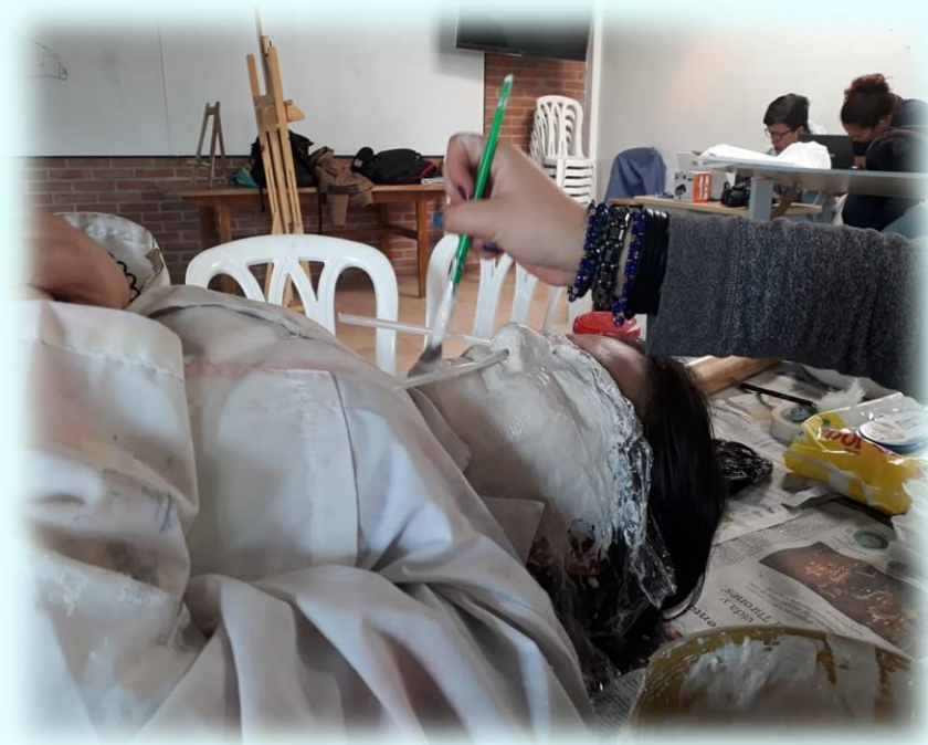
Ilustración 15. Proceso de barnizado, pieza de la alegría

era por medio de señas con las manos, este trabajo fue un poco agotador porque debía permanecer sonriendo durante todo el proceso de la pieza y más encima tenía los pitillos dentro de mi nariz, entonces ya se pueden imaginar cómo me sentía. En diferentes ocasiones mis compañeros me hacían reír, cuando esto ocurría ocasionaba que me doliera la nariz ya que tenía los pitillos en ella, al final todo salió bien y la pieza salió genial