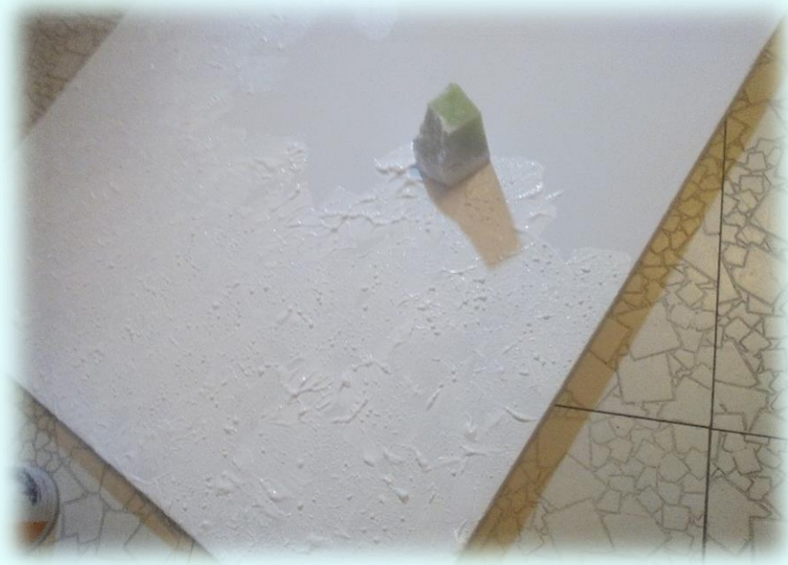
Ilustración 13. Diseño de volumen tecnica espumado