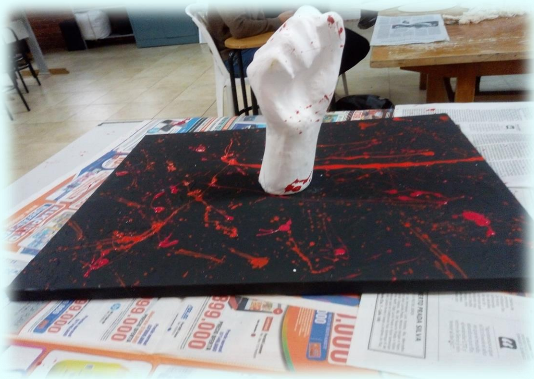
Ilustración 25. Imprimación de pintura cuadro de La rabia

tutor me ayudó y me dijo lo que podía hacer para que esto no ocurriera, una vez realizada la mezcla que mencione anteriormente la empecé aplicar y esta textura empezó a mejorar, ya no se caía la textura que le había dado a este cuadro después de que se secase lo pinte de negro y me dio la sensación de que parecía como algo súper desolado quise poner el puño y con ayuda de un pincel empecé a salpicar la pintura, utilice dos tipos de rojo y este cuadro me agradó bastante ya que cuando uno observa el puño pareciera como si tuviera sangre y también fue bastante relajante realizarlo ya que los movimientos que realice al salpicar la pintura con el pincel fue tanto el impulso que tomaba yo para hacerlo que resulte manchando el piso y la pared, después me hice un autoanálisis y pude darme cuenta que aquellos movimientos los hice como si me estuviera defendiendo de algo o de alguien.