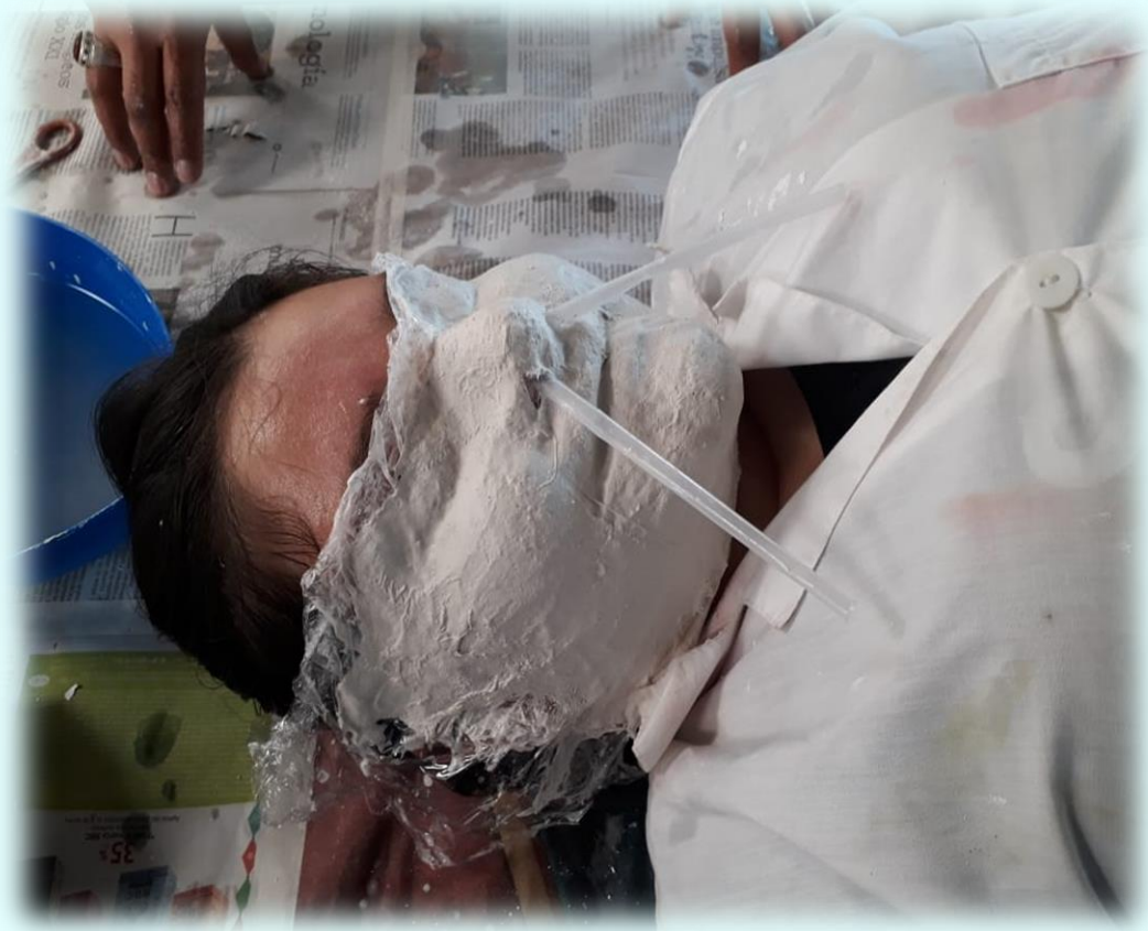
Ilustraci3n 14. Elaboraci3n mscara de la alegra

#5 Junto con la ayuda de mis compaeros y mi tutor me ayudaron a realizar la pieza que va en el cuadro de la alegra, esta pieza consiste en la sonrisa ma por lo cual yo fui la modelo, mis compaeros junto con mi tutor me ayudaron a realizar la mscara, ellos empezaron a forrarme el rostro con papel vinipel, para poder respirar me abrieron un orificio por la parte de la nariz y en ese instante introduje en mis fosas nasales unos pitillos para poder respirar bien, la verdad esta parte fue un poco inc3moda y se volva ms inc3moda cuando ellos sin culpa movan los pitillos, esto me lastimaba un poco y me causaba piquina, despu3s de cubrir por completo el rostro y de pegar bien el papel en mis rasgos del rostro, empezaron a poner el yeso de vendaje desde la parte de los p3mulos hasta el ment3n, una compaera sin culpa al momento de colocar una venda movi3 un pitillo, la verdad me hizo ver estrellas, se dej3 secar el yeso para despu3s aplicar el yeso moldeable este deba estar muy lquido para que se secara mucho ms rpido la pieza y que se pudiera moldear bien mis facciones del rostro, como tena los ojos cerrados no poda observar nada de lo que estaban realizando mis compaeros, simplemente me poda limitar a escuchar y para poderme comunicar con ellos