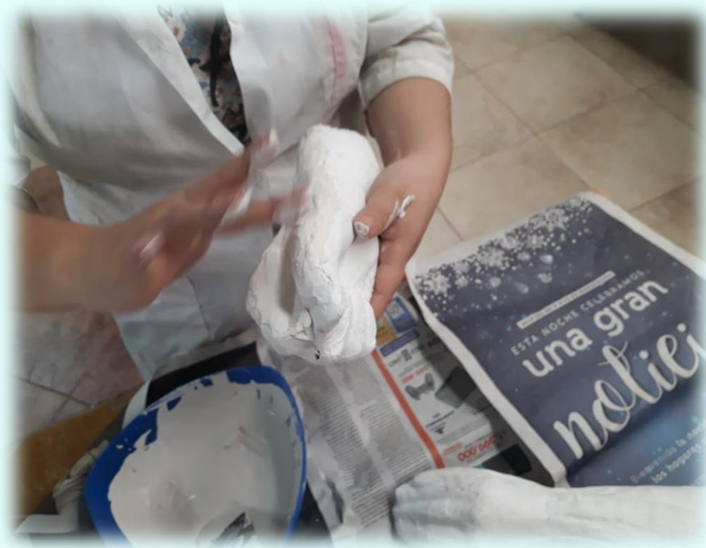
Ilustración 11. Pulido de la pieza del puño

#3 Días después se les fue echando yeso moldeable a las piezas y al momento de aplicar este yeso, sentía una sensación en las manos que algunas veces era chévere como otras veces de lo mismo frío que estaba me hacía doler bastante las articulaciones, se fueron organizando las piezas y después de que se fueron secando empecé a lijar para quitar los grumos que tenían las piezas, realmente esta parte del trabajo me hizo sentir un poco frustrada porque mis manos se cansaban bastante rápido y a pesar de que sabía que debía seguir más de una vez me tocó hacer pausas activas, porque las manos no me daban para seguir trabajando.