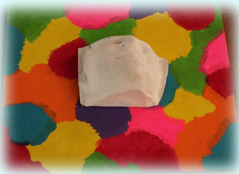
Ilustración 31. Cuadro de la alegría