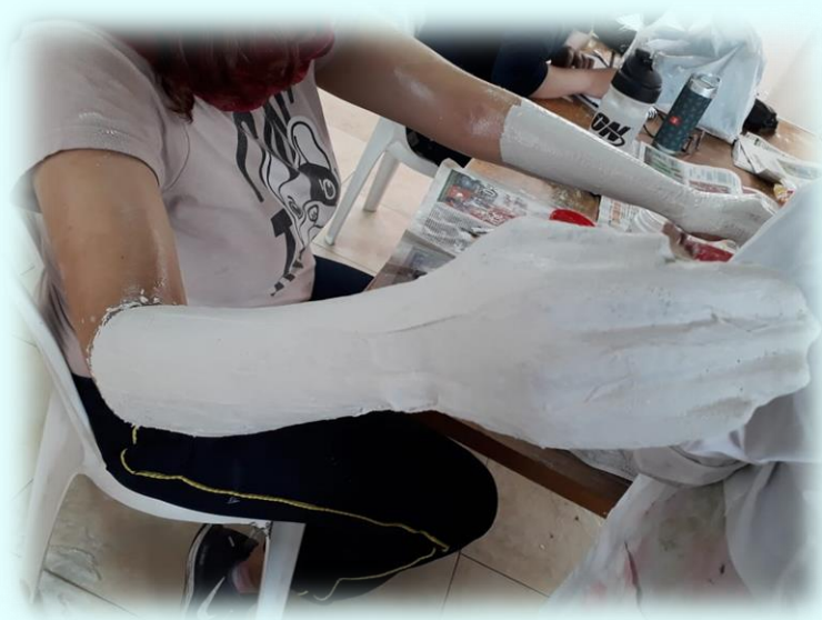
Ilustración 8. Técnica de elaboración moldes del cuerpo

Se secaron las dos piezas y se realizó el mismo corte con bisturí, al principio fue fácil quitar las piezas, pero ya después fue un poco más complejo porque la modelo se puso nerviosa ya que se tuvo que utilizar bisturí para cortar el yeso para que la modelo pudiera sacar los brazos. Se sacaron los dos piezas e igualmente se les hizo el mismo procedimiento para cerrarlas ya que quedaron abiertas y se les puso inmediatamente la venda, pero para ser sincera la pieza derecha yo ya veía que estaba quedando mal y veía algo raro que realmente no me está agradando mucho a comparación de la pieza izquierda ya que el brazo y la parte de las manos y muñeca no quedó tan resaltada cómo quedó la pieza izquierda, la verdad no estaba muy convencida de esa pieza, pero continúe porque quería ver cómo quedaban después de haberse secado.