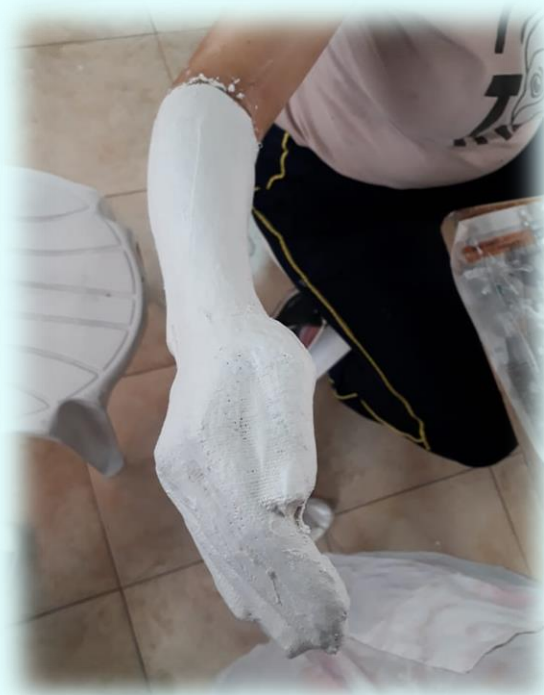
Ilustración 7. Técnica de elaboración moldes del cuerpo