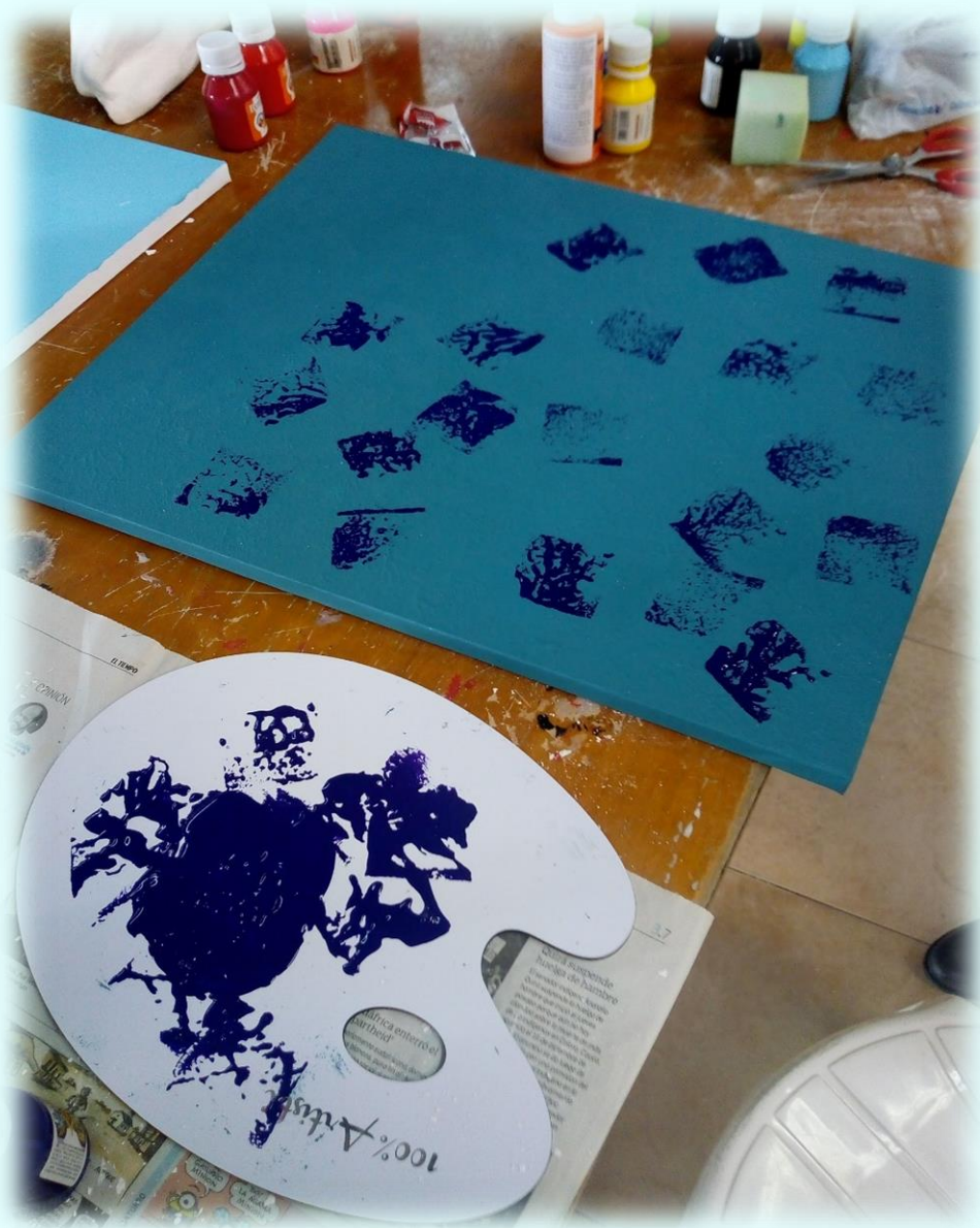
Ilustración 24. Creación intuitiva

que no me nacía y no sabía bien cómo hacerlo y mucho menos como expresar algo con lo que me sintiera identificada.