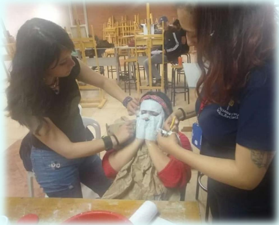
Ilustración 2. Técnica de elaboración de máscara de la frustración

me puse un poco nerviosa y ansiosa, fue pasando el tiempo y mis compañeros me iban poniendo el yeso, realmente yo no podía ver quien estaba e incluso lo que estaba pasando alrededor mío y simplemente me limitaba a escuchar, ya después de un tiempo mis compañeros me dijeron que ya habían acabado, en ese momento me sentí frustrada ya que se me había olvidado decirles que necesitaba que me taparan parte del mentón, como tenía el yeso en el rostro y no podía mover ni la boca ni las manos para indicarles, realmente no sabía cómo decirles a ellos que me cubrieran la parte del mentón, busqué la forma de decirles y esta fue mostrando y moviendo la cabeza con las manos y haciendo ruidos con la boca, al final lo logré.