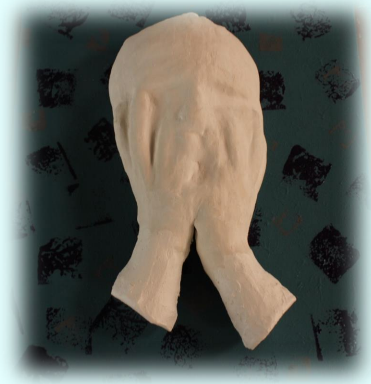
Ilustración 27. Cuadro de la frustración