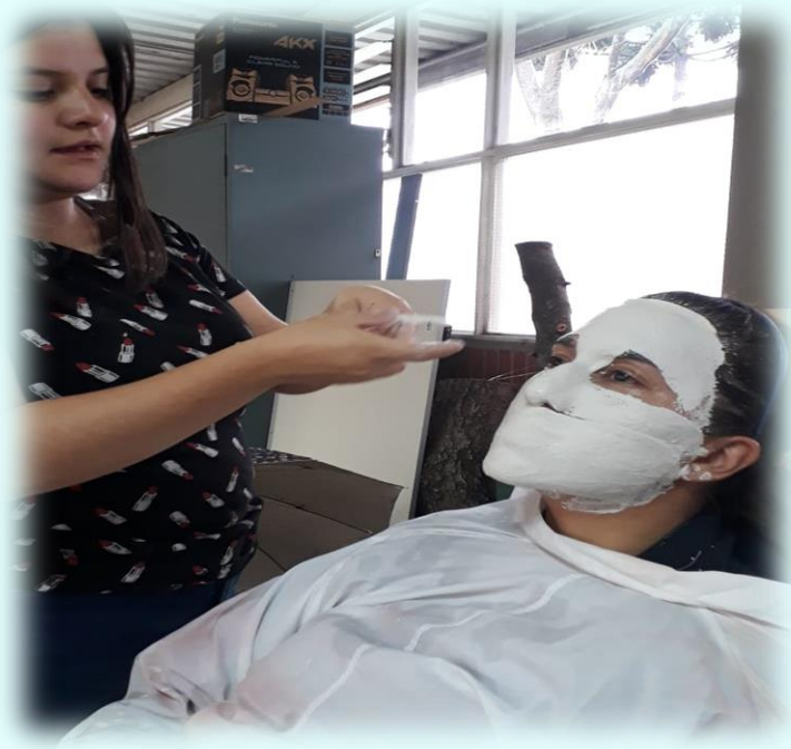
Ilustración 10. Técnica de elaboración de máscara

Antes de realizar esta máscara, se realizó la pieza del brazo que consiste en que la mano debía estar un poco encorvada ya que ésta es la que le pondrá al rostro la máscara de oxígeno, esta pieza hace parte del cuadro de la tristeza, pero para ser franca esta se me ha dificultado un poco ya que la parte de la palma de las manos es un poco complicado de que el yeso se aferró bien a la mano, ya que queda un poco templado entonces éste tuvo que buscar la mejor forma para colocarlos, en estas parte tocó cortar las vendas un poco más cortas para ponerlas y que no quedara tan templadas, en esta ocasión la modelo sufrió un poquito ya que al momento cuando estaba cortando la pieza para quitarla, con la punta del bisturí la alcancé a chuzar un poco, para ser franca el trabajo con esta modelo siempre fue un poco agotador y esto me genero un poco de estrés, ya que como se mencionó anteriormente varias veces la modelo no se quedaba quieta y me dificulta bastante colocar las vendas e incluso cuando ya estaban puestas las vendas, los mismos movimientos que ella realizaba generaba que se quebrará el yeso.