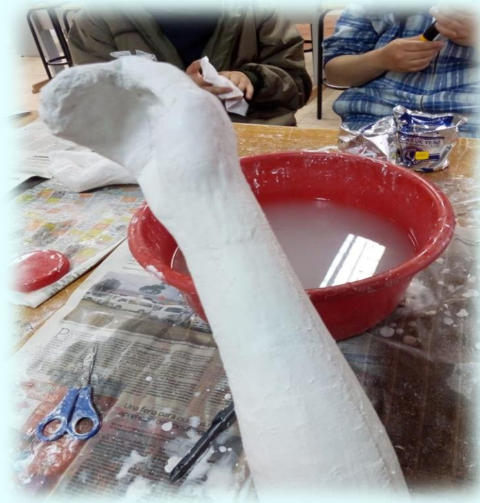
Ilustración 9. Técnica de elaboración moldes del cuerpo

con yeso de vendaje, la expresión del rostro en esta máscara quise que fuera bastante sencilla los ojos cerrados con la boca cerrada ya que está tendrá la máscara de oxígeno.