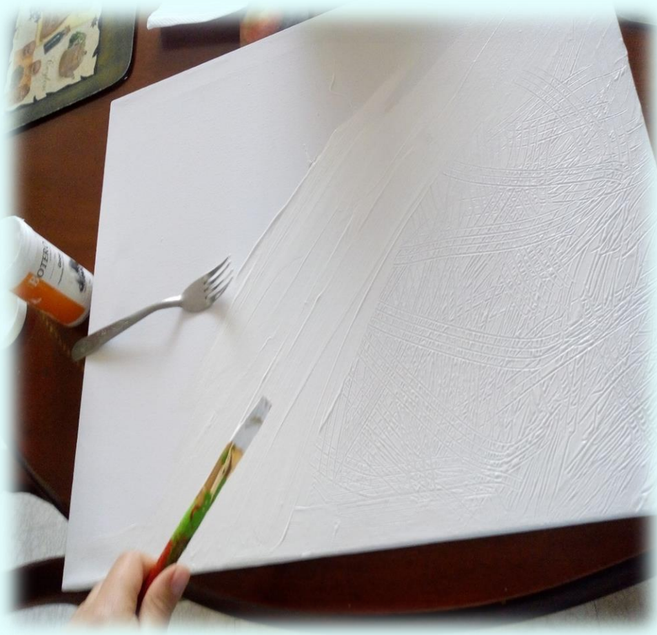
Ilustración 16. Diseño de volumen sobre el cuadro del encierro

#6 Me encontraba jugando con mi perro y él sin culpa me rasguño, entonces en ese momento me hizo pensar en el cuadro del encierro, sobre que sería genial si al lienzo se le pudiera hacer una textura como si fueran rasguños, quise probar y tome un lienzo con gesso y un tenedor, empecé aplicar el gesso con un pincel sobre el lienzo y después con un tenedor empecé a simular rasguños sobre el lienzo, esto me pareció divertido pero a la vez debía tener cuidado ya que la fuerza con la que le estaba haciendo podría ocasionar que el lienzo se dañará, lo iba a colocar a que se secura pero sin culpa casi se me cae y con el pulgar de la mano derecha se tropezó el lienzo y con la uña de este dedo se hizo un rasguño, pensé que lo había dañado y que la textura que le había dado con él tenedor se había dañado, pero ocurrió todo lo contrario no fue algo tan notorio, fue curioso y esto surgió de la nada ya que es lienzo se me iba a caer y mi reacción fue tomarlo con esa mano