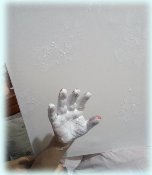
Ilustración 20. Manos escondidas en el lienzo