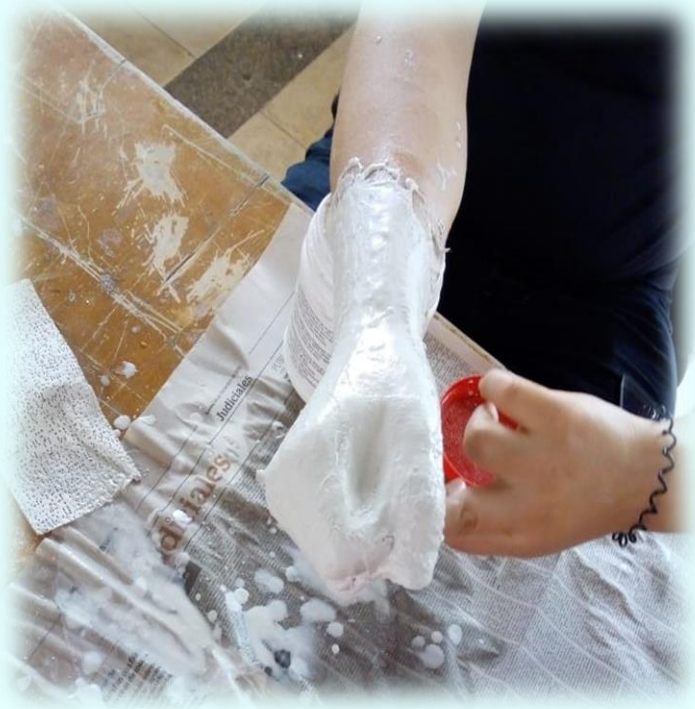
Ilustración 4. Técnica de elaboración moldes del cuerpo

#2 Desde muy temprano empecé a realizar las piezas del segundo, tercer y cuarto cuadro. organice los materiales para dar inicio a la construcción de las piezas, comencé a realizar la pieza del cuadro de la rabia que consiste en un puño, tuve como modelo a un hombre ya que me parecía el puño más grande que el de una mujer, esta pieza se empezó a realizar desde más abajo de la muñeca hasta los dedos tapando por completo la mano con el yeso de vendaje, al momento de realizar esta pieza a comparación de la anterior pieza que fue el de la frustración, la sensación fue más relajante ya que pues no fui la modelo y fue más sencillo porque fue en la mano, este se fue secando y después al igual que con la pieza de la frustración se hizo el mismo corte con bisturí para lograr sacar la mano y que la pieza quedará intacta, cuando se realizan estos cortes las piezas quedan abiertas por lo tanto se debe cerrar y la cerramos fue con la misma venda de yeso, siempre que llego a esta parte de las piezas me da bastante nervios ya que me da miedo cortar al modelo