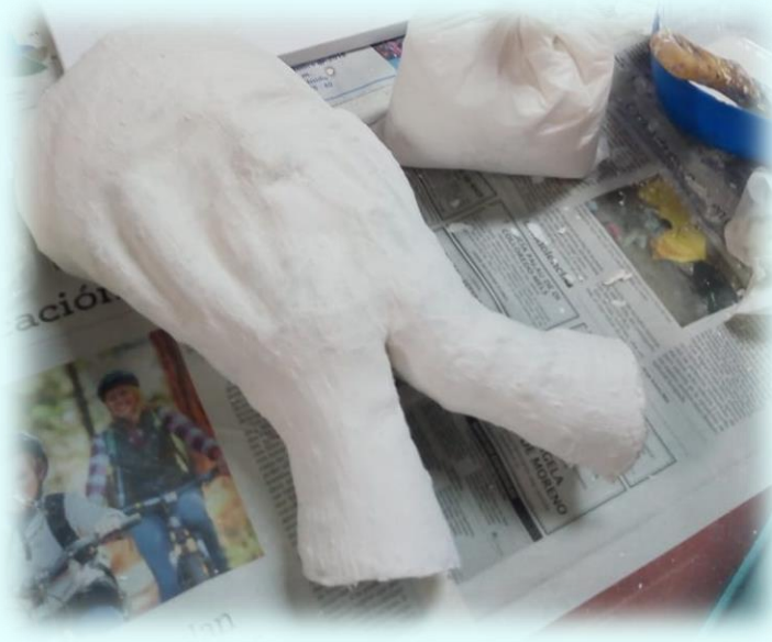
Ilustración 3. Pieza de la frustración

entonces empecé hacer diferentes gestos y demás y al final se logró despegar la máscara del rostro, pero la parte de las manos y las muñecas no se pudo quitar ya que me habían tapado por completo con yeso estas partes, mi tutor tuvo que ayudarme también a quitar esta parte de la pieza haciendo un corte con bisturí, eso me causó bastante nervios, pero al final todo salió bien y nadie salió cortado ni herido. Se puede decir que dejé la pieza del primer cuadro que es la frustración ya terminada para después pulir y arreglar los detalles. En la siguiente imagen se puede observar cómo quedó esta pieza.