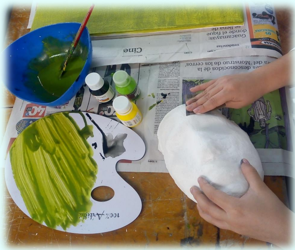
Ilustración 12. Pulido de mascara

#4 Realmente no tenía pensado darle textura a los cuadros, pero me encontraba en un situación la cual me dio mucho mal genio, tenía una esponja y gesso cerca y empecé a untar la espuma de gesso y comencé a darle toques al lienzo con la esponja, al principio no me sentía muy bien que digamos pero ya después me di cuenta que eso me estaba relajando, por lo cual decidí terminar y por lo tanto realicé todo el lienzo con esos mismos toques que generaba con la esponja, ya después me fui dando cuenta que estaba generando una textura en el lienzo, al final cuando termine la verdad me gustó y ya me sentía mucho más relajada de lo que estaba. Para ser franca pensé que me iba a quedar feo porque empecé hacerle muy fuerte al lienzo con la esponja e incluso pensé que se podía haber dañado por la misma fuerza que le estaba haciendo con la esponja. Al final de todo esto, no solo me gusto lo que surgió a partir de una situación de enfado, sino también fue un buen ejercicio para tranquilizarme y canalizar mi estado de ánimo.