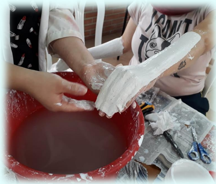
Ilustración 6. Técnica de elaboración moldes del cuerpo