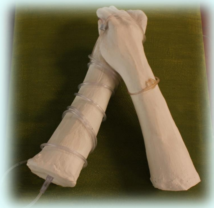
Ilustración 29. Cuadro del encierro