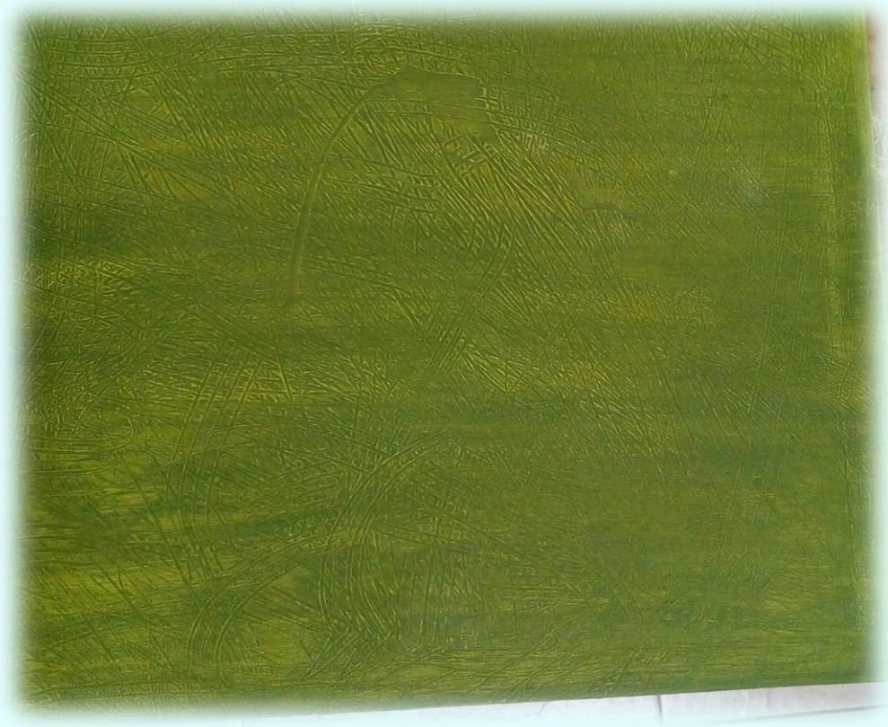
Ilustración 26. Imprimación de pintura cuadro del encierro

Ya para finalizar termine con el cuadro del encierro, mezcle verde, negro y amarillo y surgió un color que la verdad al momento de pintar me parece que da como especie de neblina por qué en unos lugares queda más oscuro que en otros, y en otros quedaba un poco más claro, me parece que es perfecto para la temática que se está manejando en ese cuadro que es el encierro y más porque la textura que se quiso dar con el tenedor se resalta mucho. Este color me pareció muy curioso y lo elegí ya que pienso que es un color que llega a ocultar muchas cosas y que además logra engañar, principalmente lo asocio mucho con lo que acabo de mencionar ya que es realmente lo que me ocurre, ya que a simple vista puede ser un color bello, pero si uno se pone a detallar o incluso lo asocio con la mezcla de los colores que utilice, llega a ocultar muchas cosas que a simple vista no se logra ver.