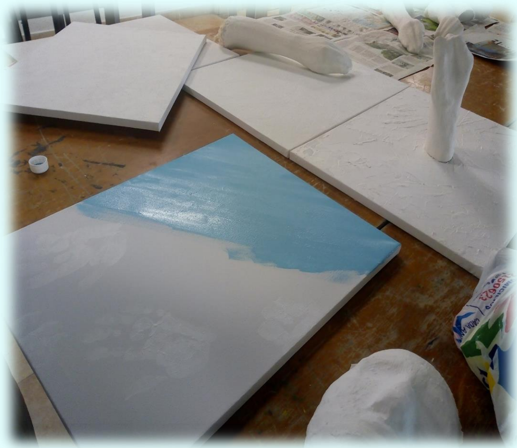
Ilustración 22. Imprimación de pintura

Cuando me encontraba pintando el cuadro de la alegría realmente no me sentía muy bien y tampoco sé porque lo hice, utilicé diferentes colores llamativos con el amarillo, verde, fucsia, cereza, azul, naranja y lila. Pinte con pincel pero a medida que lo iba pintando había algo que no me llamaba la atención y no me sentí a gusto con lo que estaba haciendo pero aun así continúe pintando, al final cuando terminé de pintar me di cuenta que los colores se estaban obstruyendo uno con el otro como si estuvieran nublados y eso me hizo pensar y recordar que hace bastante tiempo no me siento muy alegre que digamos y yo creo que por eso mismo se me dificulto tanto realizar este cuadro y también se juntan colores con otros como formando una neblina y creando una explosión de colores que quieren sobresalir, tuve muchas dudas de este cuadro después de haberlo terminado pero decidí dejarlo porque me siento identificada con ese cuadro por lo mismo que mencioné anteriormente y porque cuando hago referencia sobre “la explosión de colores que quieren sobresalir” pensé que hay muchos sentimientos míos que quieren salir o ser escuchados.