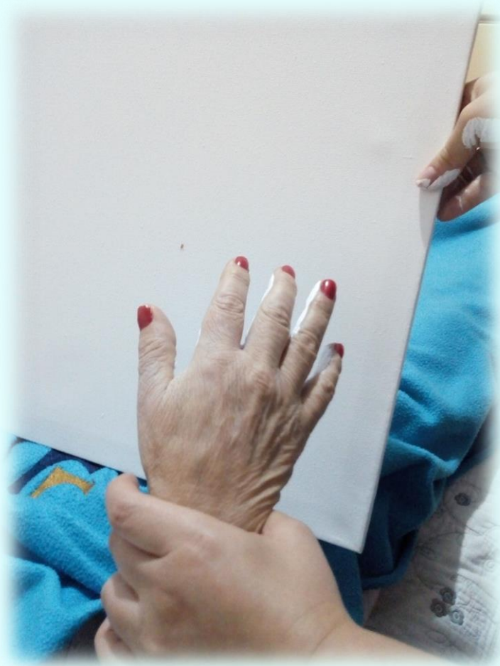
Ilustración 19. Impresión táctil

5 alegría: este es el lienzo que tiene salpicado y que se sopló con el pitillo el yeso moldeable