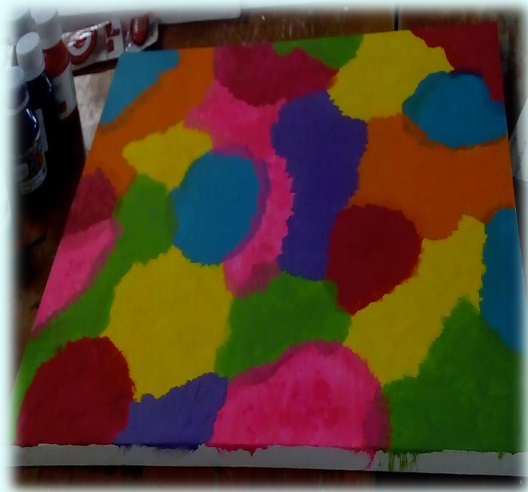
Ilustración 23. Composición tonal, cuadro de la alegría

Para el cuadro de la frustración, quise utilizar colores oscuros, puedo decir que a comparación del cuadro de la alegría, este me fue más fácil de realizar tanto en la preparación del color del fondo como al momento de utilizar la espuma, este color surgió a partir de la mezcla de azul con negro y cuando lo fui realizando me quedó gustando demasiado y de cierta forma me sentí identificada con ese color y por eso mismo lo quise plasmar en el cuadro, recorte la espuma en cuadros y la unte de acrílico morado y lo que hice fue dejar caer la espuma sobre el lienzo y levantarla con cuidado para que no quedara la espuma muy pintada en el cuadro esto lo hice con una espuma más pequeña y utilice el color gris. el proceso de este cuadro fue mucho más relajante que el de la alegría, la verdad pienso que el cuadro más estresante fue el de la alegría porque fue algo bastante incómodo para realizar ya