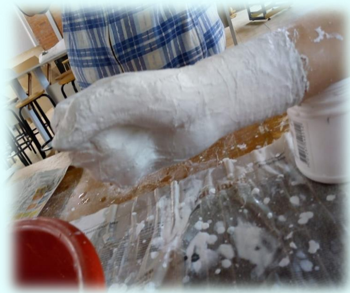
Ilustración 5. Técnica de elaboración moldes del cuerpo

Luego empecé con las piezas que van en el cuadro del encierro ya que estas dos piezas consisten en los brazos cruzados atados por un cable de oxígeno, para ser franca estas piezas fueron fáciles de hacer pero siempre tuve un inconveniente con una pieza que fue el brazo derecho ya que al momento de realizarlo la modelo varias veces se movió y después se comenzó a quebrar el mismo yeso estando esta pieza en la modelo, realmente no sé qué fue lo que pasó ahí con esa pieza ya que esa pieza se realizó igual que la del brazo izquierdo, estas dos piezas se fueron realizando casi parejas ya que se preparó y se alistó todo el material para realizarlas, se empezó primero con el brazo izquierdo y luego con el derecho está se vendaron del codo hasta los dedos completamente y se les fue colocando varias capas de yeso de vendaje para que al momento de quitarlas no se quebraran y no quedaron tan débiles.