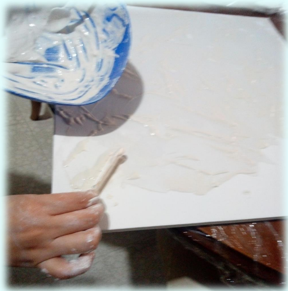
Ilustración 18. Diseño de volumen intuitivo

no untar nada porque le podía dañar las cosas ya que ella se encontraba acostada viendo tv y podía untar alguna cobija, siempre fue un poco complejo plasmar las manos de mi mamá en el lienzo ya que la mano de mi mamá es demasiado pesada y ella no me ayudaba a moverla como quería, varias veces le dije que abriera los dedos, pero cuando tenía la mano puesta sobre lienzo era que habría los dedos y yo le decía que no hiciera eso por qué se corría todo el gesso, al final no se notó nada de eso y quedaron las manos de mi mamá sobre el lienzo.