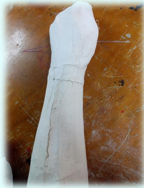
Ilustración 21. Pieza fallida

Quise pintar el cuadro de la tristeza de color azul cielo, porque al ver este color me produce tranquilidad y cómo lo había mencionado en mis anteriores bitácoras quiero con este cuadro jugar una doble moral, me refiero a que el fondo puede transmitir tranquilidad e incluso este color se puede llegar encontrar en diferentes hospitales, por esto mismo lo quise pintar de ese color. Al pintar este cuadro fue algo sencillo y mientras iba pintando me fueron pasando por mi mente recuerdos de diferentes cosas que me han ocurrido y más que todo llegue a pensar sobre el impacto que puede generar este cuadro una vez terminado.