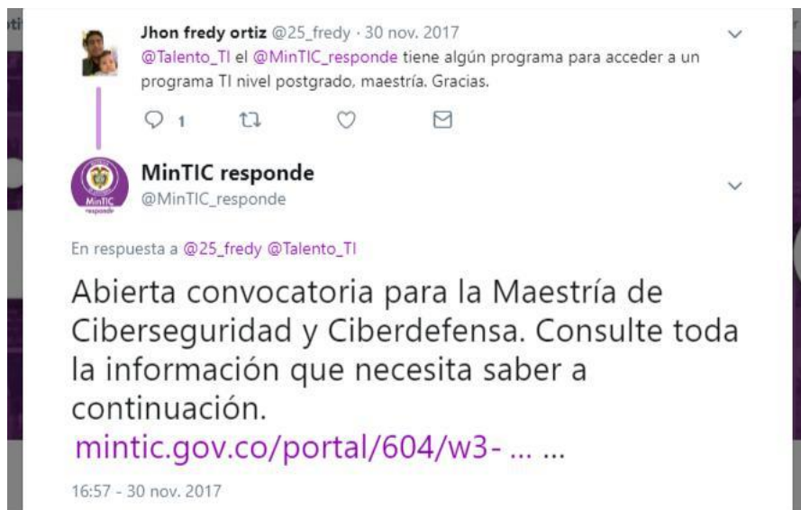
Figura 3. Ejemplo de respuesta en la cuenta: (Véase más en el anexo)