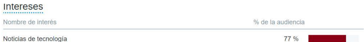
Figura 2. Porcentaje de Usuarios interesados en Noticias de Tecnología