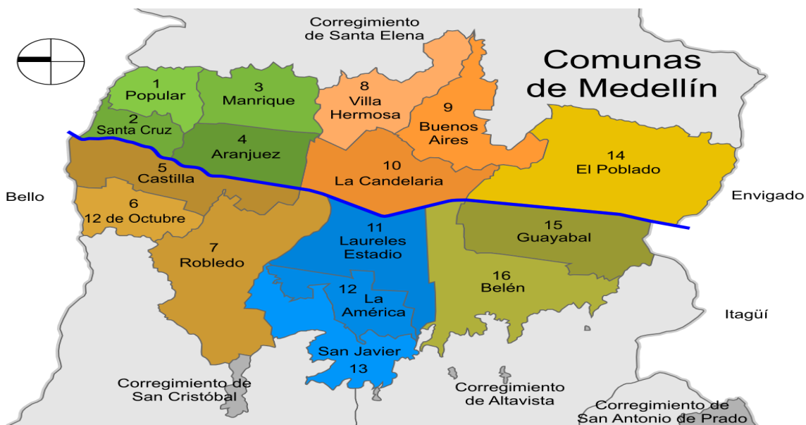
Gráfico 1: Localización Comuna 13.

La comuna 13, San Javier es una de las 16 comunas de la ciudad de Medellín. Esta localizada al occidente de la zona centro occidental de la ciudad, limita por el norte con la comuna 7 Robledo, por el oriente con la comuna 12 la América y la comuna 11 Laureles- Estadio, por el sur con el corregimiento de Altavista y al occidente con el corregimiento de San Cristobal.