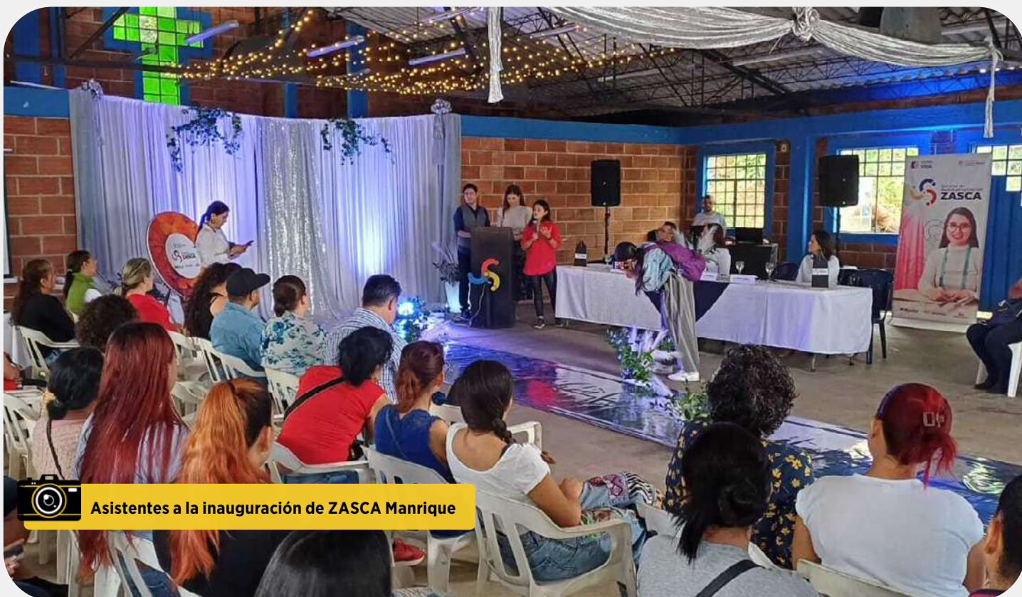
Asistentes a la inauguración de ZASCA Manrique

La Corporación Industrial Minuto de Dios, en alianza con el Ministerio de Comercio, Industria y Turismo, iNNpulsa Colombia y la Cámara de Comercio de Medellín para Antioquia, dio inicio al Centro de Reindustrialización ZASCA Manrique. Esta iniciativa promete transformar la vida de cientos de emprendedores y empresarios de la región. Con este nuevo centro, se busca fortalecer las capacidades de las empresas locales , fomentando la innovación, la sostenibilidad y la competitividad. Los beneficiarios del programa tendrán acceso a capacitación especializada, asesoría empresarial y espacios de coworking, entre otros servicios.