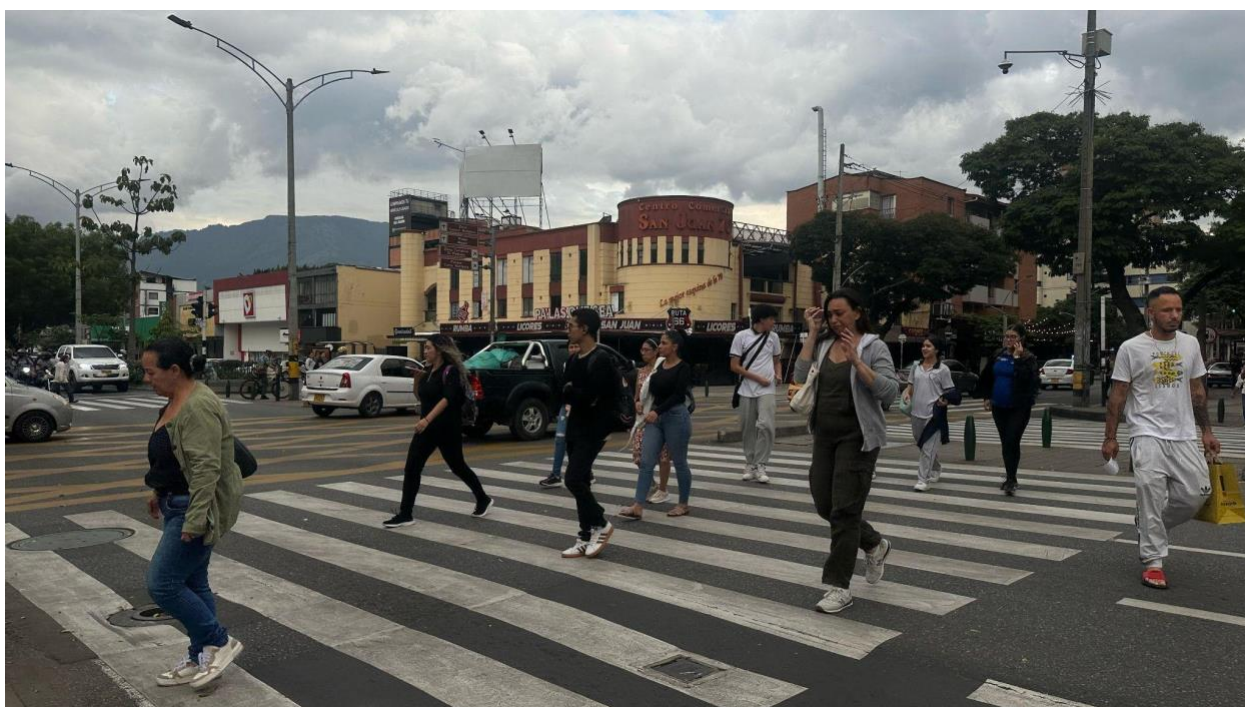
Figura 1. Avenida San Juan Laureles