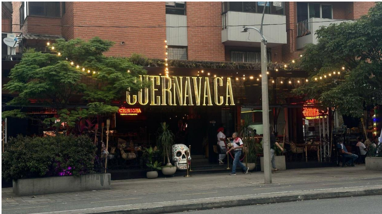
Figura 3. Restaurante mexicano CUERNAVACA la 70