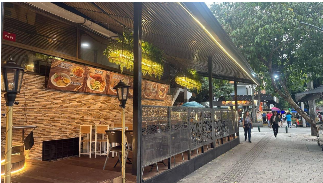
Figura 4. Restaurante Gourmet la 70

Necesitamos un Laureles que sea para todos, no solo para unos pocos.