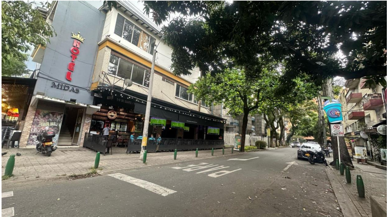
Figura 2. Calles de laureles