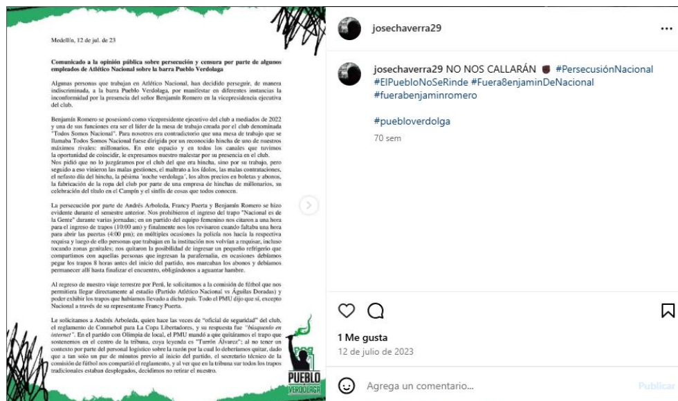
Figura 3. Integrante de Coperos