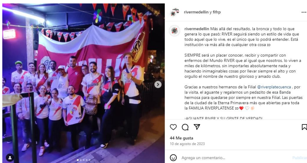
Figura 11. Integrantes Filial River Plate Medellín