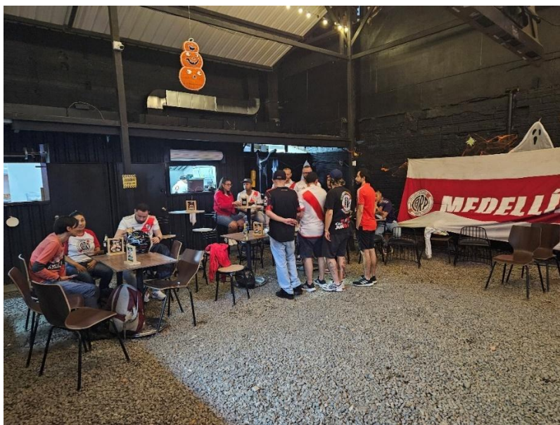
Figura 8. Integrantes Filial River Plate Medellín