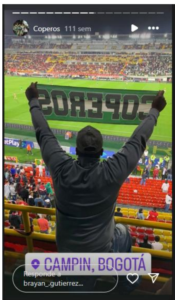
Figura 10. Integrantes Coperos