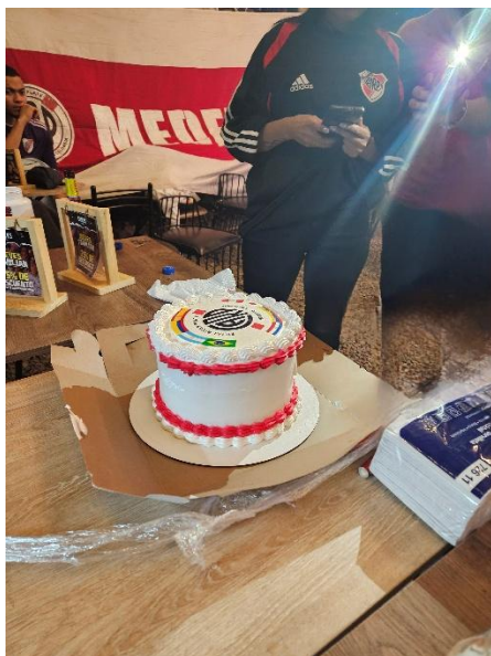
Figura 7. Integrantes Filial River Plate Medellín