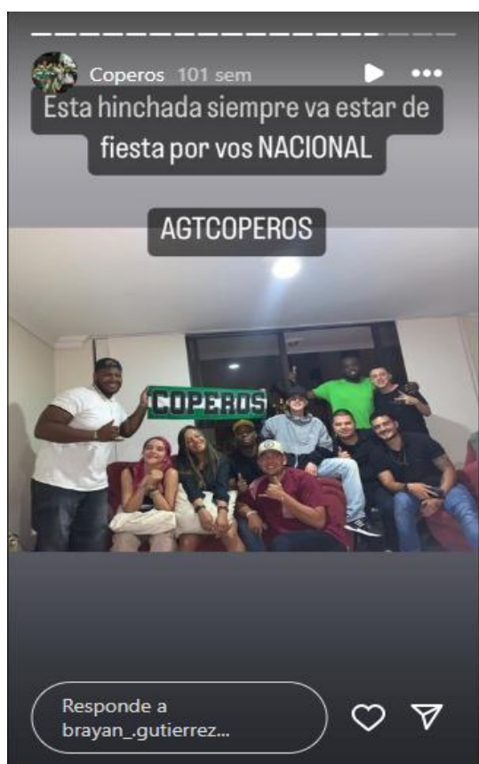
Figura 9. Integrantes Coperos