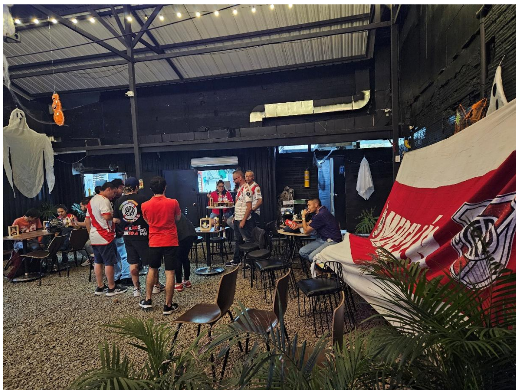
Figura 12. Integrantes Filial River Plate Medellín