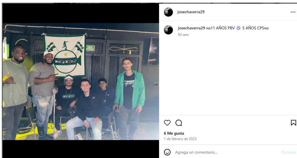
Figura 4. Integrante de Coperos