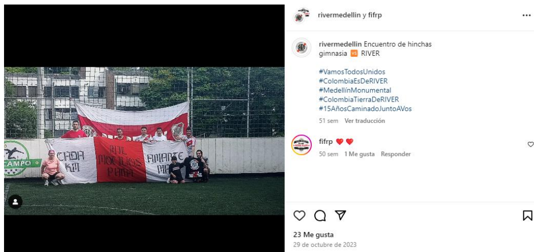
Figura 5. Integrantes Filial River Plate Medellín