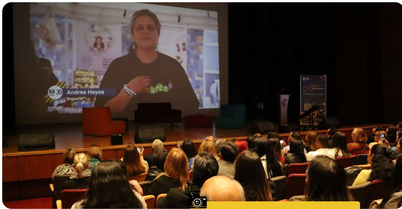
Evento De 40 mil a 100 mil latidos de Micronegocios

La Corporación Industrial Minuto de Dios, a través de MD Micronegocios, presenta 100 Mil Latidos, una movilización nacional que invita a ciudadanos y empresas a unirse con un aporte solidario desde $3.500 diarios para fortalecer los micronegocios que sostienen la economía popular del país.