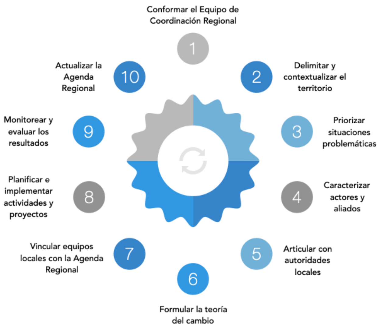
Ilustración 2. Ciclo de gestión de la Agenda Regional. Fuente: elaboración propia.

Se sugieren diez (10) pasos para formular, implementar, evaluar y mejorar una Agenda Regional de I+D+i+C, los cuales pueden ser ajustados de acuerdo con la experiencia del equipo que trabaja en ella. Es importante resaltar que las Agendas Regionales son cíclicas y no lineales, en este sentido, están en constante cambio y deben ser ajustadas periódicamente con el fin de garantizar que la teoría del cambio sea pertinente a las necesidades y problemáticas de las personas, comunidades y territorios.