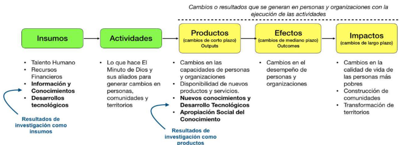
Ilustración 3. Diagrama de la cadena de resultados en las Agendas Regionales de I+D+i+C.

La siguiente ilustración presenta la conceptualización de una cadena de resultados: