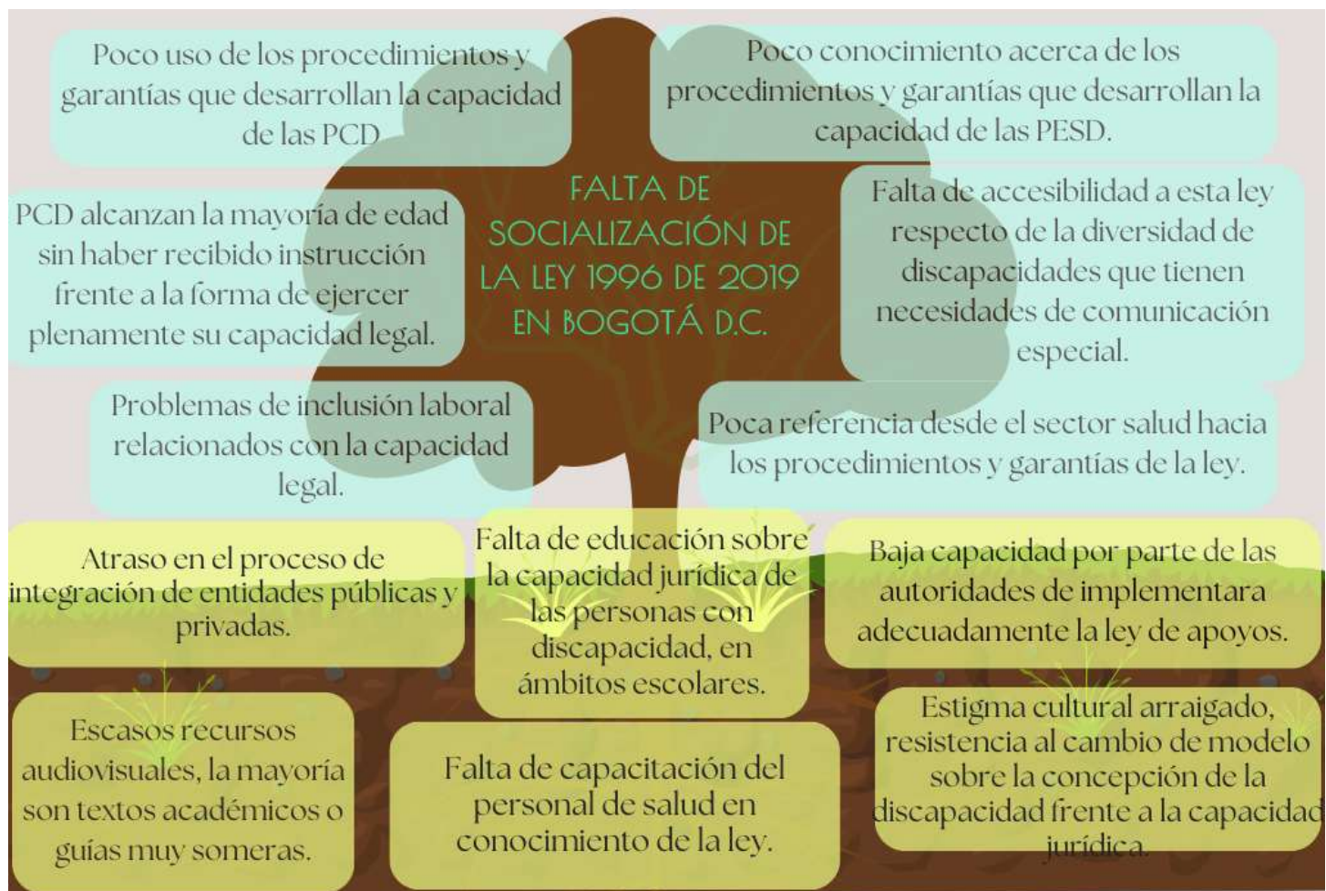
Ilustración 1 Árbol de problemas: causas (abajo) y consecuencias (arriba). Elaboración propia (Canva)