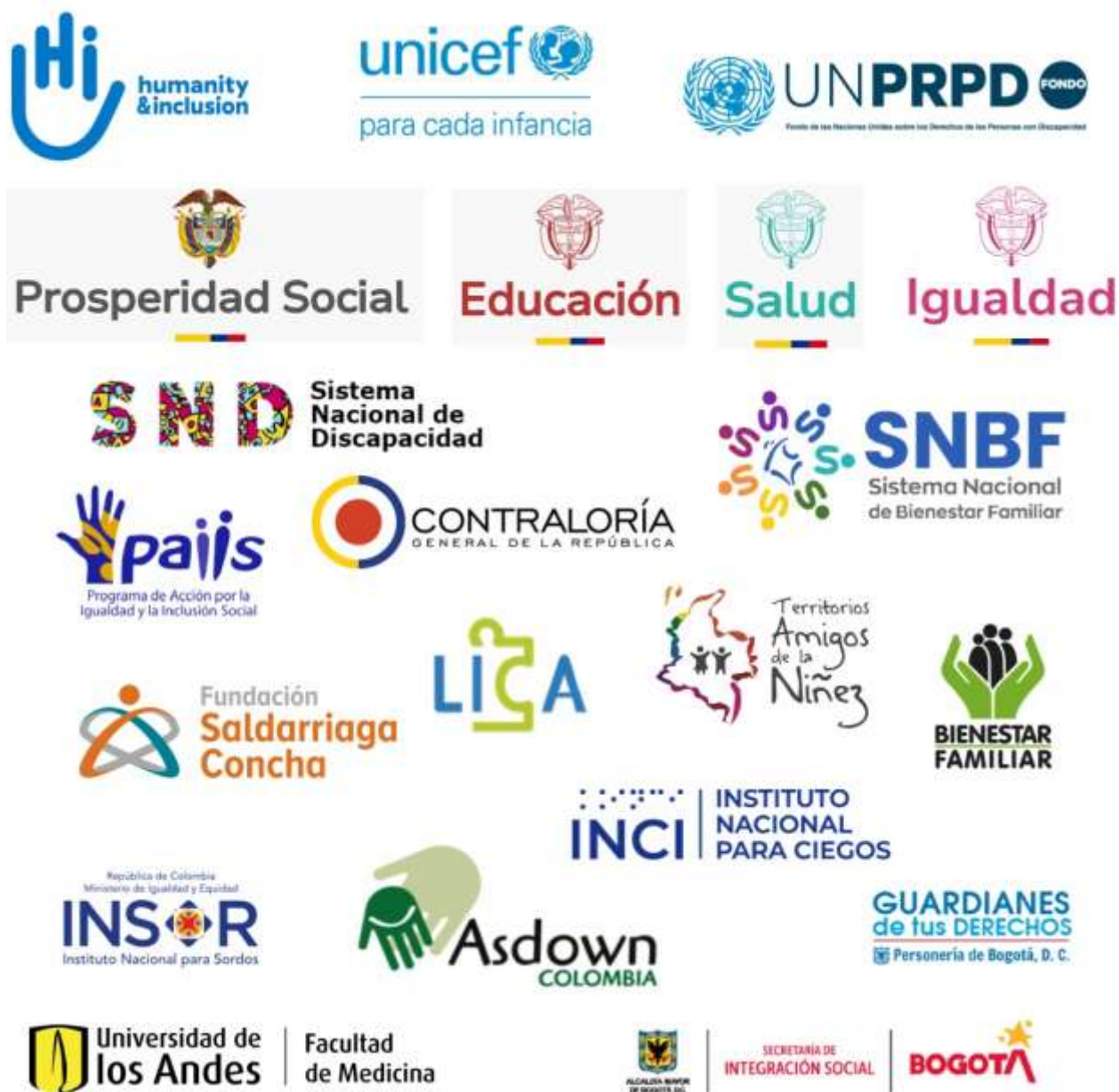
Ilustración 4. Aliados Programa de Gestión Inclusiva. Elaboración propia.

Para aplicar esta teoría en Bogotá, y según las directrices de Montoya (2013) es menester identificar actores clave, con base a sus funciones, capacidades y del aporte que pueden significar para el despliegue de una alianza. Tal es el caso del PGI, que logra permear la mayor parte de las aproximaciones institucionales posibles, en aras de la inclusión de las personas con discapacidad.