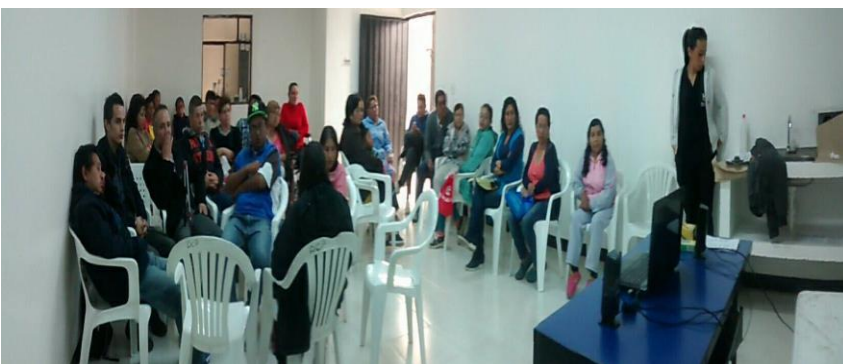
ANEXO 2. Evidencia primera sesión. Elaboración propia. (2017).