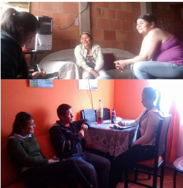
ANEXO 1. Visitas domiciliarias. Elaboración propia. (2016)