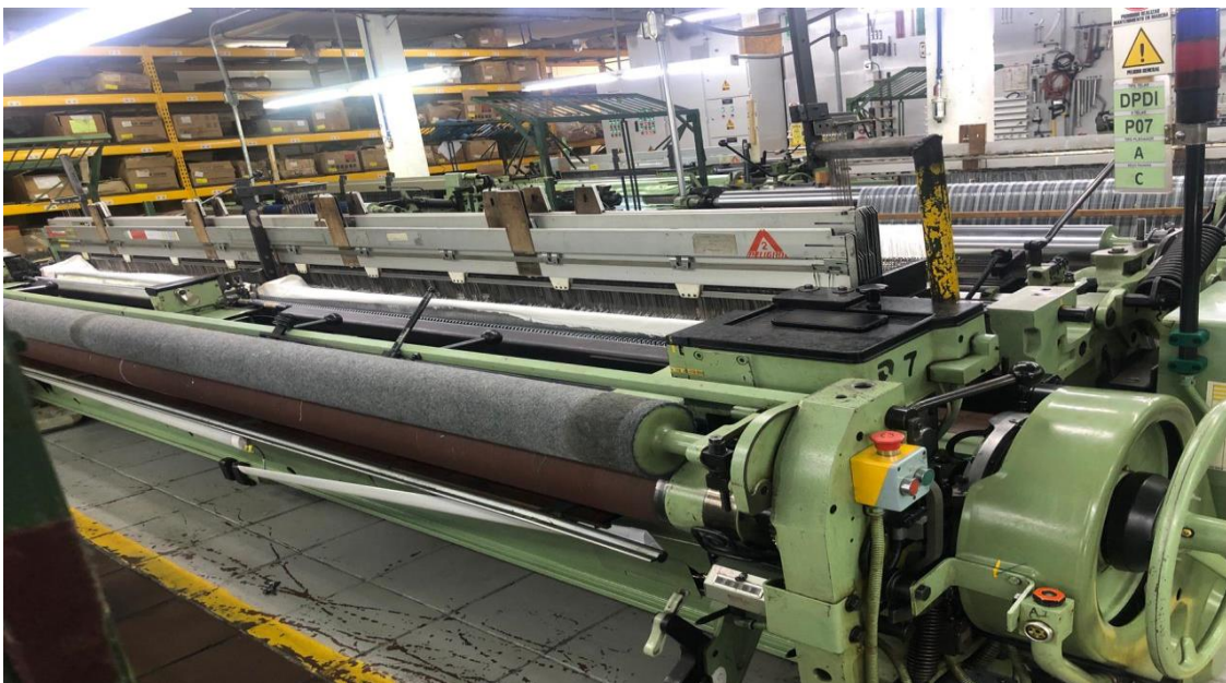
Figura N. 2. P7 Telar de proyectil PU

Gracias a este proyecto se está logrando que Textiles Dislana cada vez que compre o adquiere un activo cumplan con el protocolo de ingreso de la manera correcta para controlar y llevar trazabilidad a cada uno de ellos.