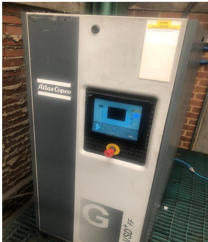
Figura N. 3. Compresor Atlas Copco

La clave de una buena gestión de activos es que optimiza todos los procesos. Esto significa que la gestión de activos tiene en cuenta todo lo anterior y determina cuál es la mejor combinación de actividades a fin de lograr el mejor equilibrio de todo lo mencionado para el beneficio de la organización