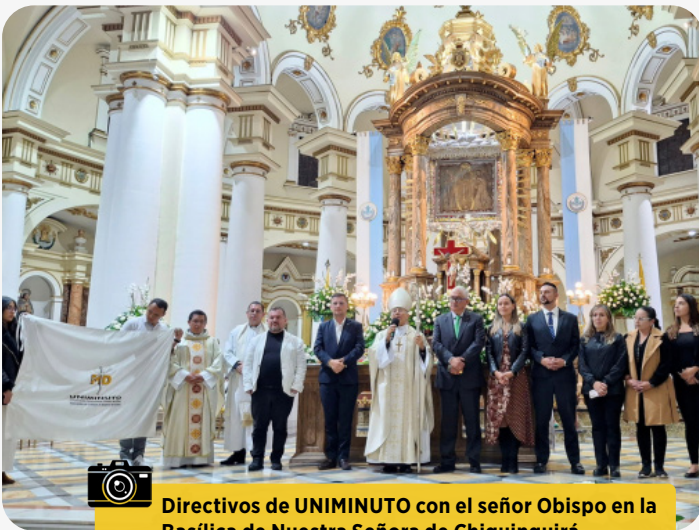
Directivos de UNIMINUTO con el señor Obispo en la Basílica de Nuestra Señora de Chiquinquirá

La población de la Capital Religiosa de Colombia se sintió orgullosa que una institución de educación superior esté en su territorio, ofreciendo posibilidades de crecimiento. En un ambiente de alegría, con los corazones encendidos por la esperanza, se celebró la llegada oficial del Centro Universitario UNIMINUTO Chiquinquirá.