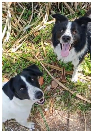
Observación de los paseos. Orión y Mayden.

El concepto de tenencia actual, se enfoca más en el disfrute mutuo que en la responsabilidad, existe una tendencia a subestimar el tiempo, la capacidad económica y el esfuerzo necesario para suplir todas las necesidades físicas, psicológicas y sociales del animal. Esta falta de conciencia se traduce a menudo en la adquisición impulsiva y en un desconocimiento sobre el impacto de la raza, la edad o la condición física del animal en la vida familiar, en la observación se hizo evidente que múltiples dueños de razas de alto rendimiento físico como el Border Collie, Pastor Alemán, Huskies, etc., no cuentan con el tiempo necesario para suplir las necesidades físicas, por ello optan por contratar servicios de paseos o personas que cuiden al animal durante la ausencia del propietario.