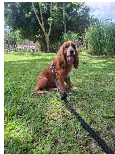
Honey en la cancha de Cristo Rey.

Esta redefinición social tiene un fuerte movimiento legal, la legislación, como el Estatuto Nacional de Protección de los Animales en Colombia, ha evolucionado para reconocer la necesidad de bienestar animal y, a través de la jurisprudencia, se ha abordado el concepto de "animal de compañía" para distinguirlo de los animales de trabajo o de producción. El marco legal internacional, como la