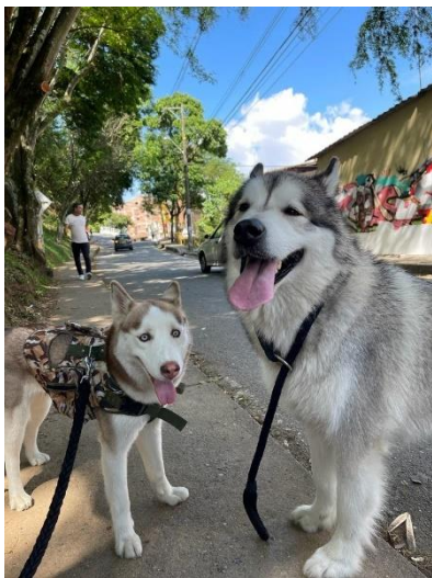
Razas Siberian Husky y Alaska Malamute: Muffin y Max.

Respecto a la sensibilización de estos animales, una porción significativa de la población no tiene plena conciencia de que la relación humano-animal se originó en la utilidad biológica y económica (caza, guardia, control de plagas) antes de evolucionar hacia la compañía. Aunque se acepta el concepto de "animal de compañía" como un miembro de la familia, persiste un desconocimiento sobre las implicaciones legales y de bienestar animal más allá de las necesidades básicas (comida, agua, refugio).