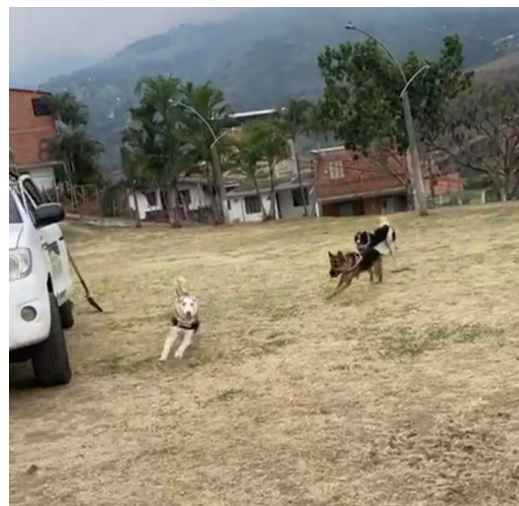
Perros jugando en la zona verde de la cancha Cristo Rey. Muffin, Haru y Mayden.