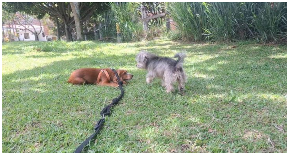
Perro callejero se acerca a socializar.