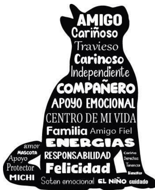
Figura 2. Simbología del gato. Elaboración propia

Así determina Azúa (2003) como la agricultura atrajo roedores a los campos de cultivo y los gatos, que eran depredadores naturales de estas plagas, comenzaron a merodear en estas áreas para cazarlos. Con el tiempo, los humanos notaron que los felinos eran beneficiosos para sus cultivos, ya que ayudaban a controlar las plagas. Aunque los felinos seguían siendo ariscos, el hombre simplemente les permitía hacer su trabajo. Por consecuencia los gatos que se acostumbraron a la figura humana, lo que dio paso a la transformación de la especie hasta llegar al gato actual ( Felis domesticus ).