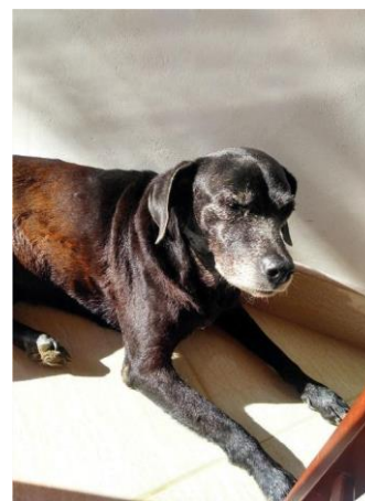
Recordatorio de Clara.

Hoy en día, el perro de servicio cumple funciones particulares para ayudar a propietarios con discapacidades o enfermedades, con ocho tipos de entrenamiento especializados: desde perro lazarillo hasta perros de alerta médica o asistencia para trastornos mentales. De estos se desprenden los perros de apoyo emocional, que ayudan a regular las emociones de dueños con trastornos psicológicos, y los de compañía, que se tienen por el simple placer afectivo. Beatriz Vásquez explica que su perra, en un inicio, cumplió una función enfocada en el bienestar emocional de su hija, pero con el crecimiento de la menor, esta función cambió y ahora es propiamente un animal de compañía. En la actualidad, el perro es considerado principalmente un miembro de la familia y, aunque la utilidad sigue ligada a la relación, el foco está en el vínculo afectivo que proporciona salud mental y bienestar.