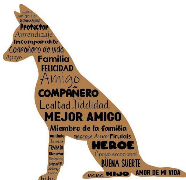
Figura 1. Simbología del perro. Elaboración propia.