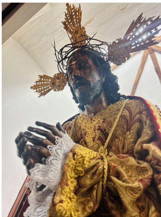
Figura 2. Imagen de Jesús Nazareno Marinilla.