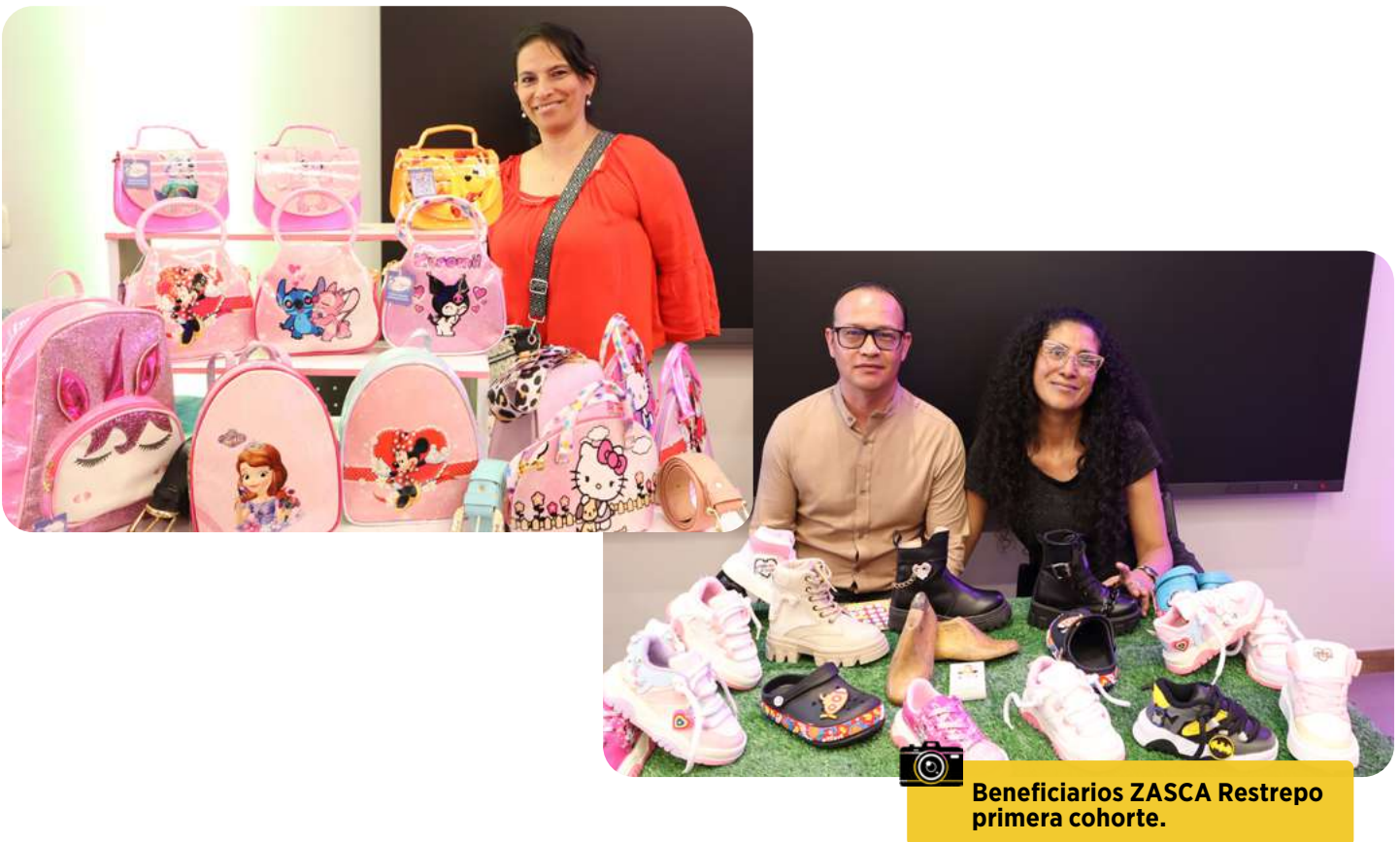
Beneficiarios ZASCA Restrepo primera cohorte.

La Corporación Industrial Minuto de Dios invita a quienes tengan un taller o negocio de confección y marroquinería en el barrio Restrepo y sus alrededores, en Bogotá, a ser parte de la segunda cohorte del Centro de Reindustrialización ZASCA Manufactura Restrepo, una iniciativa del Ministerio de Comercio, Industria y Turismo, iNNpulsa Colombia, la Cámara de Comercio de Bogotá y SENA.