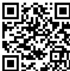
Figura 3. Estrategia Pedagógica La Jigra

Por tal razón, la jigra está compuesta por diferentes herramientas didácticas direccionada al fortalecimiento de oralidad, articulación de los saberes propios y los dados en la educación formal, dicha estrategia esta direccionada de acuerdo a las orientaciones que se han dado por mandato desde las asambleas que se organizan a nivel de cada plan de vida, en donde analizan y se proyectan a seguir construyendo diversas dinámicas de fortalecimiento cultural como pueblo indígena Nasa del Cauca. A continuación, en el link encontraran el diseño y estructura de la estrategia pedagógica la jigra .