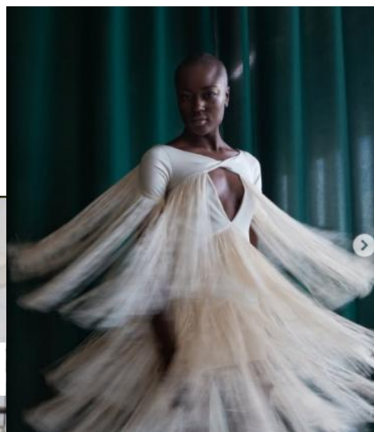
Figura 3. @Colombiamoda_oficial