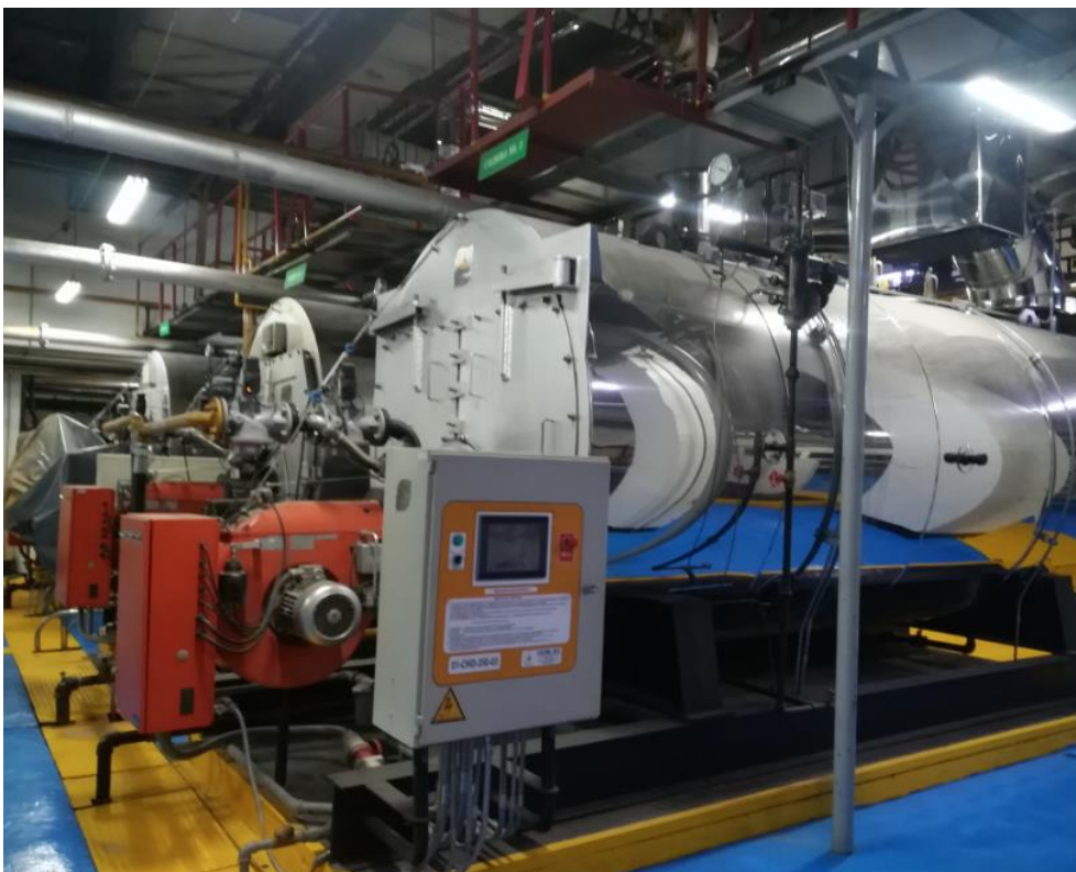
Imagen 2. Imagen Área de Calderas de IPS de alto Nivel de complejidad en la Ciudad de Bogotá.