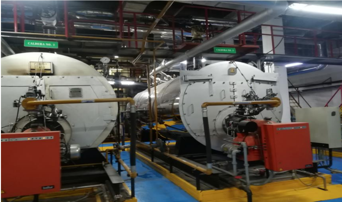
Imagen 1. – Imagen Área de Calderas de IPS de alto Nivel de complejidad en la Ciudad de Bogotá