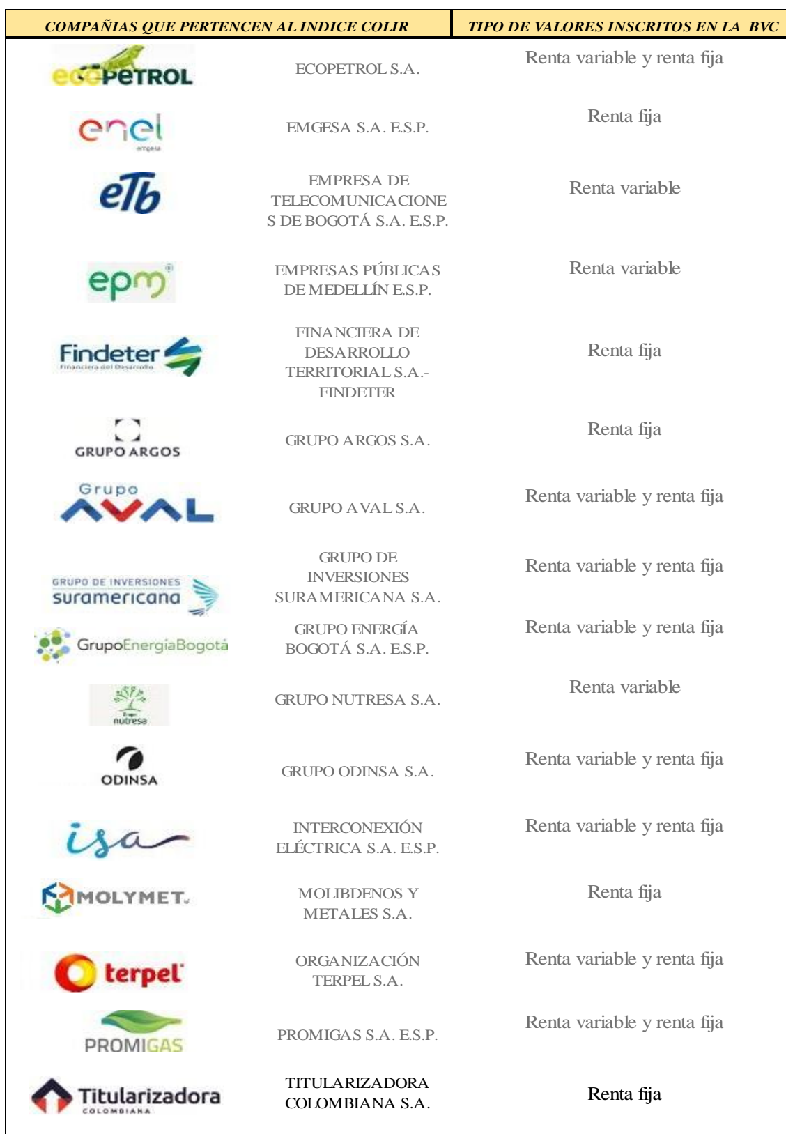
Tabla 7 Listado de empresas con reconocimiento IR