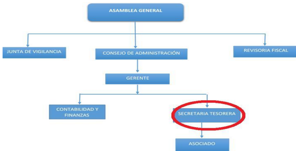
Figura 2. Organigrama de la COOTRALAG., (Fuente: Cooperativa Integral de Trabajadores del Club los Lagartos.)

En la figura 1, se presenta el organigrama de COOTRALAG., compuesta por la asamblea general, consejo de administración, junta de vigilancia y revisoría fiscal, el cual estas dependencias son encargadas de escoger el gerente general, la contadora y a su vez la secretaria tesorera, en este caso la práctica se realizó en el área de secretaria tesorera.