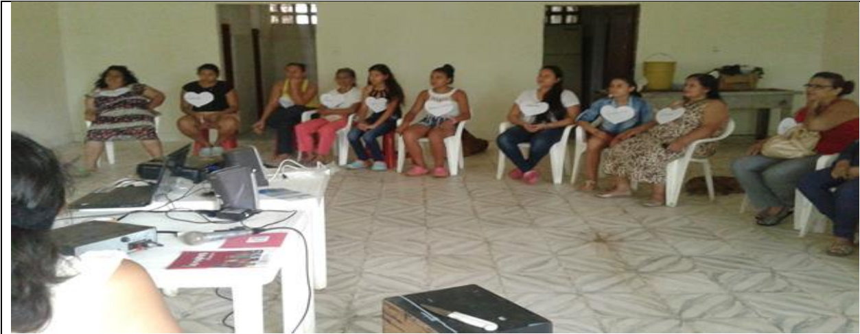
Fotografía No. 7 Grupo focal, participación comunitaria, Comuna 10 de Neiva.