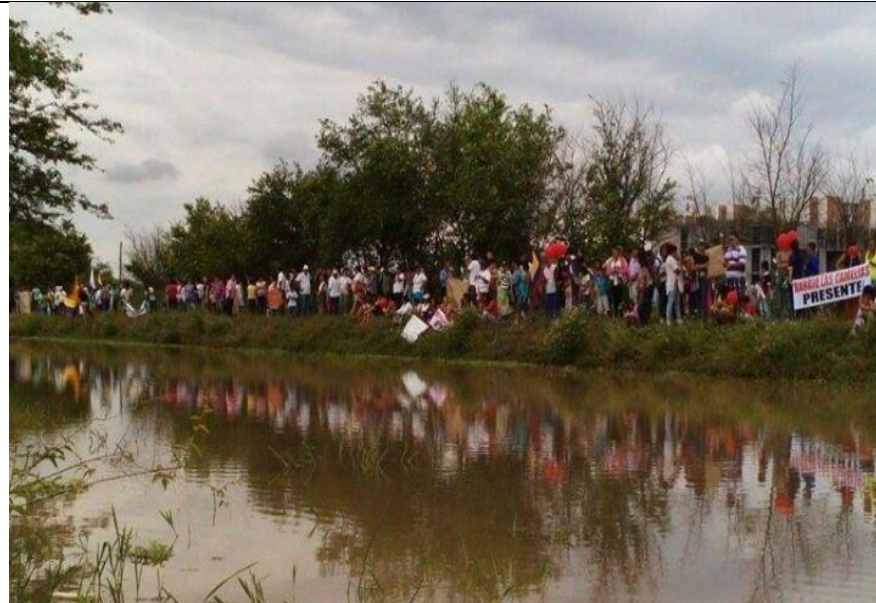
Fotografía No. 2 Lideresas de la Comuna 10 de Neiva, en plantón por la defensa del humedal Los Colores.