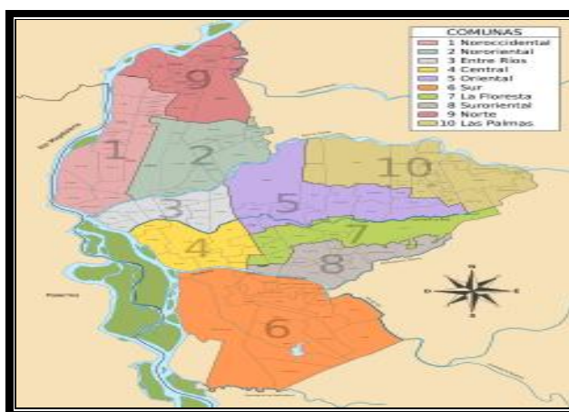
Ilustración 2 Mapa del municipio de Neiva por Comunas.

Los habitantes de la comuna 10 se caracterizan por estar albergados en viviendas autoconstruidas bajo deficientes condiciones de habitabilidad, construidas por material obtenido de la basura: cartón, plástico, papel. Se formaron por ocupaciones espontáneas de terrenos, públicos o privados, sin reconocimiento legal, en terrenos marginados con elevados riesgos para las viviendas allí asentadas en laderas de altas pendientes, terrenos poco estables, zonas inundables en las márgenes de ríos y quebradas.