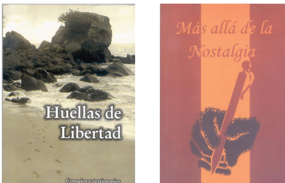
Figura 2. Portadas de los libros redactados en la cárcel por Aníbal Carrera

Otro de los internos que ya obtuvo la libertad escribió dos libros, uno de poesía y otro plasmando los testimonios de algunos de sus compañeros de prisión que lograron iniciar una vida de fe en Dios.