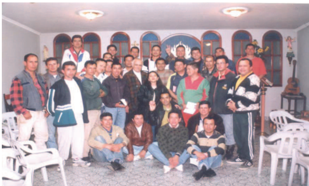
Figura 1. Grupo de Renovación Católica en la cárcel de la Policía de Facatativá en el año 2005

Esta nueva forma de vida, hace que el interno experimente la libertad interior a causa de un perdón de Dios que ya se dio y el gozo del Espíritu Santo para seguir viviendo, esto es lo que el privado de la libertad siente entre las rejas de la prisión, experiencia que le permite salir de su incertidumbre y darse a quienes como él, estaban sin esperanza.