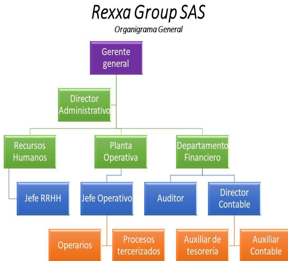
Figura 1. Organigrama funcional de la empresa (Rexxa Group SAS, 2018)