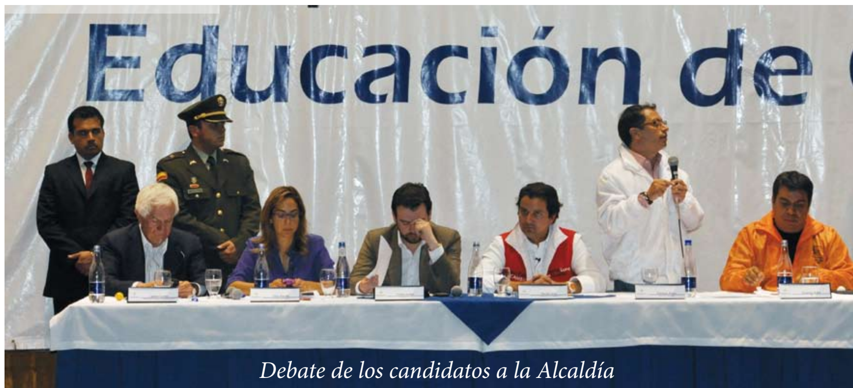
Debate de los candidatos a la Alcaldía