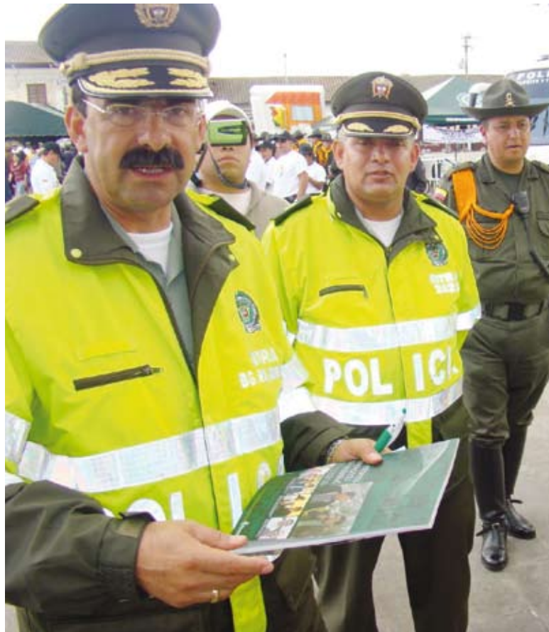
El general Palomino fue comandante de la Policía de Tránsito y realizó diversas campañas para impedir que las personas que consumían alcohol se sentaran la volante de un automóvil.

Las víctimas siguen siendo peatones, personas que asumieron su responsabilidad y tomaron un taxi, otros conductores que madrugan a trabajar, incautos rumberos que salen de los bares para sus casas. Todos tratando de escapar de las manos de la delincuencia para caer