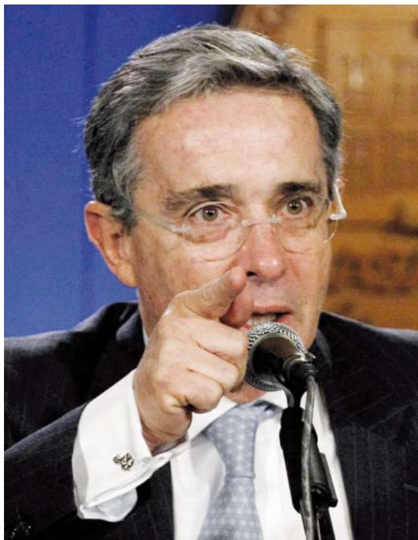
El expresidente Uribe se destacó durante su mandato por hacer fuertes críticas a la prensa y por llamar varias veces a los medios para controvertir las informaciones.

Esto es una opinión, yo no podría probarlo, pues digamos que quizá el factor económico haya sido un argumento, pero no creo que haya