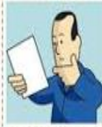
La leo con atención

Fichas de datos de seguridad: la herramienta básica para la gestión de riesgos