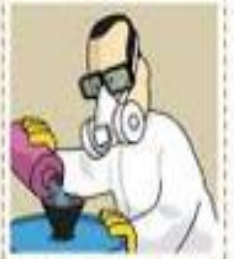
Manipulo productos químicos