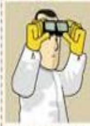
Obtengo el equipo