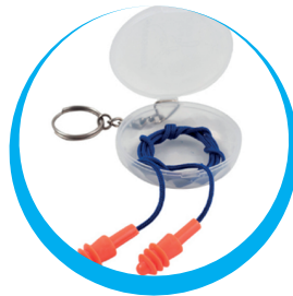
PROTECTOR AUDITIVO MASE TIPO INSERCIÓN 4 MEMBRANAS