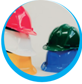
CASCO DE SEGURIDAD MASE DIELÉCTRICO