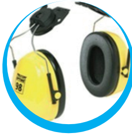
PROTECTOR AUDITIVO MASE TIPO COPA ADAPTABLE A CASCO