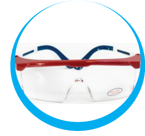
GAFAS DE SEGURIDAD MASE ANTIEMPAÑANTE LENTE CLARO