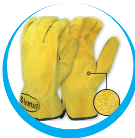
GUANTES MASE DE VAQUETA