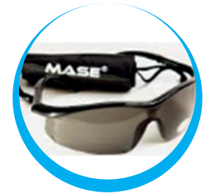
GAFAS DE SEGURIDAD MASE ANTIEMPAÑANTE LENTE OSCURO