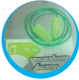
PROTECTOR AUDITIVO TIPO TAPÓN MASE