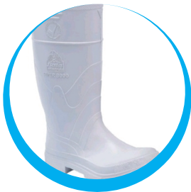
BOTA BATA LÁCTICA BLANCA CON PUNTERA