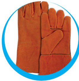
GUANTES MASE CARNAZA SOLDADOR NARANJA