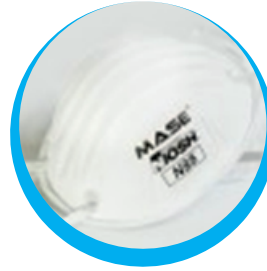
MASCARILLA N95 SIN VÁLVULA MASE CAJA X 20 UNIDADES