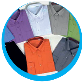
CAMISA OXFORD CABALLERO COLORES