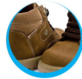
BOTA INGENIERO CAFÉ CABALLERO