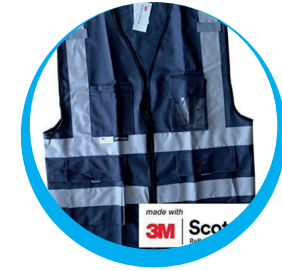
CHALECO MASE REFLECTIVO EN POLIESTER