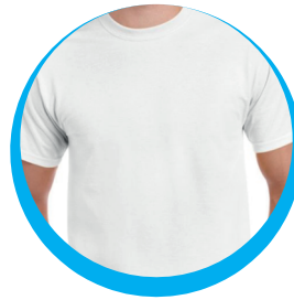
CAMISETA T-SHIRT BLANCA