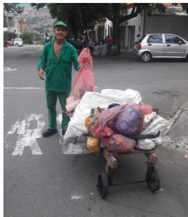
Imagen 2. Fotos tomadas en calles del barrio Aranjuez.