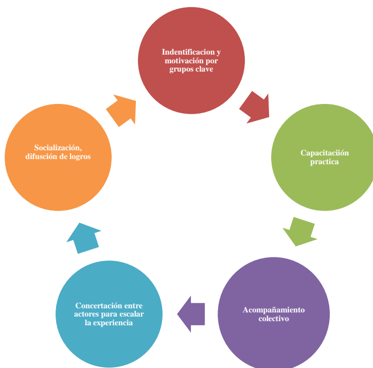
Gráfico 1. Propuesta modelo para el manejo de residuos sólidos.