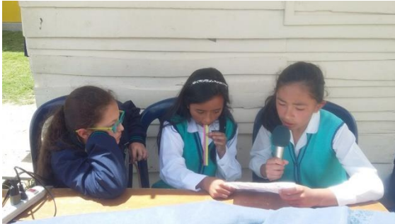
Producción de contenidos radiales elaborado al inicio del -proyecto.