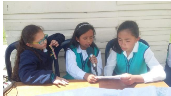
Producción de contenidos radiales elaborado al inicio del -proyecto.