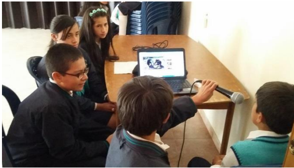
Producción de contenidos radiales elaborado al inicio del -proyecto.