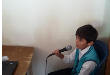
Producción de contenidos radiales elaborado al inicio del -proyecto.