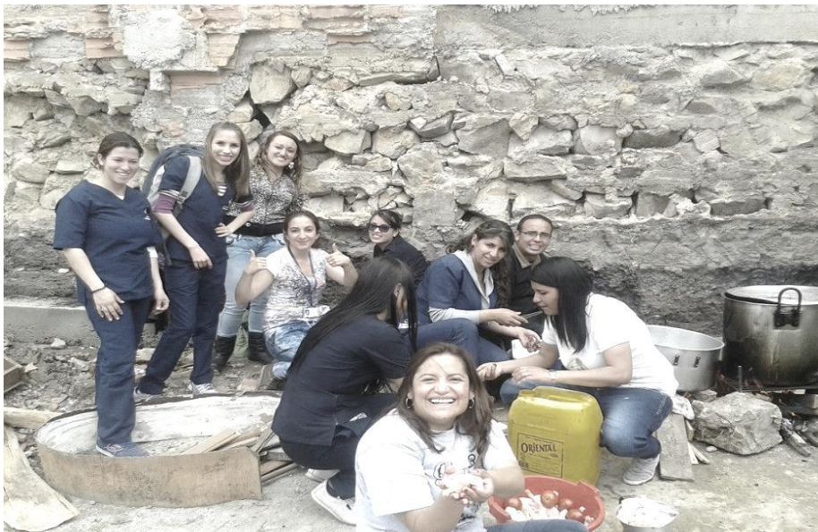
Imagén1. Salida de campo a Fundación Juvenil Revivir Siglo XXI. Docentes y estudiantes en la realización de una olla comunitaria. (2015)