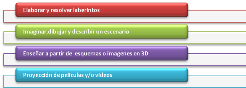
Figura 3. Actividades Inteligencia Visual-espacial

Las actividades que se pueden aplicar en el aula son las siguientes: