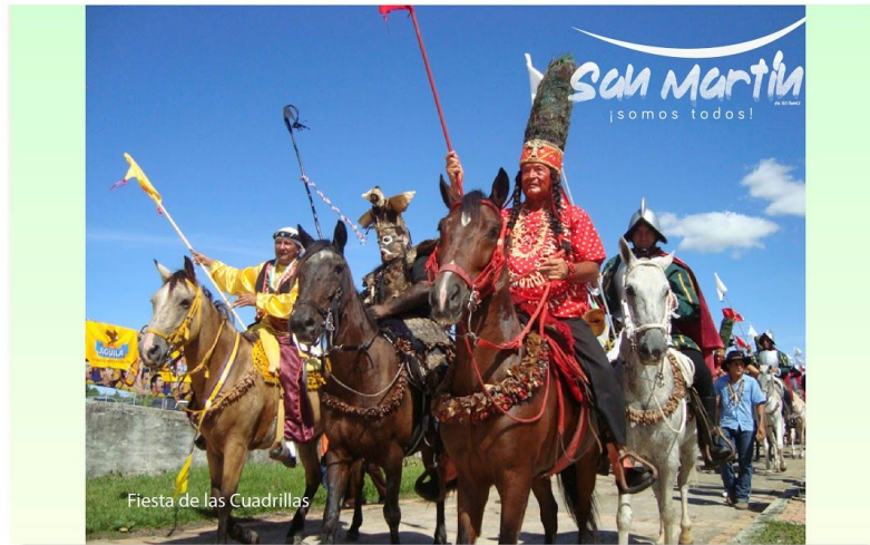
Fiesta de las Cuadrillas