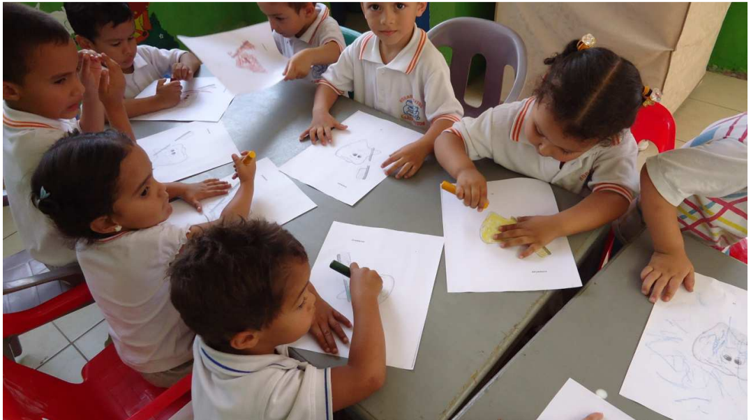
Grupo de niños coloreando los dienteitos