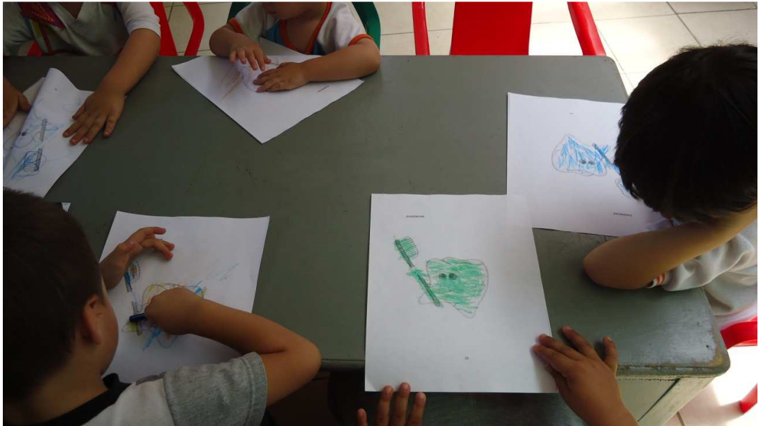
Dientecito coloreado por un niño del hogar ositos cariñositos