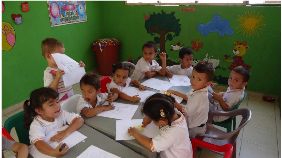
Niños coloreando el doctor muelitas en el hogar ositos cariñositos