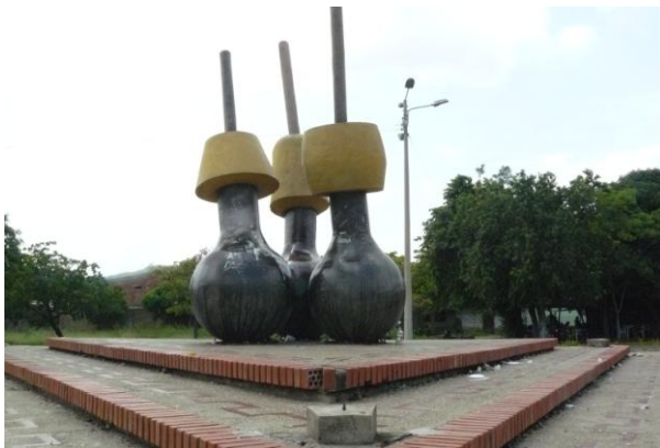
Monumento "POPOROS" Departamento del Cesar Municipio Valledupar