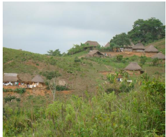
Comunidad Chemesquemena Sierra Nevada de Santa Marta – Vertiente Suroriental- Departamento del Cesar – Municipio Valledupar