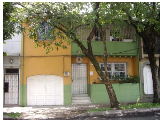
Sede Hogar Infantil

Ubicado en la Carrera 50 B/ Prado Centro- Medellín.