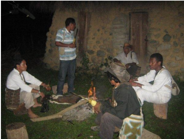
Reunión de los mamus y mayores en la Sierra Nevada de Santa Marta