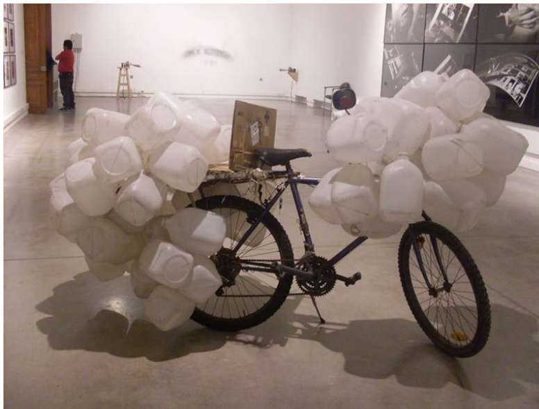
Bicicleta. Pablo Rivera 2013 .MAC

Lastimosamente y debido a la globalización y la fuerte influencia que tiene Europa sobre el país Austral, a nivel de comercio, moda, y artes; el arte plástico (pintura, dibujo, grabado), ha bajado su reinado, dando paso al arte conceptual; técnica o tendencia artística que aparece a mediados de los 60, que busca romper el concepto clásico del arte y busca mostrar el objetivo como tal, es decir ve el arte como un sistema, lo que importa es la idea no la obra como tal. “(Portal del arte.cl)”. Es decir busca la abstracción de la idea del artista, y en ocasiones busca una nueva re interpretación del mundo, y en algunos el contacto artista – espectador es la misma obra.