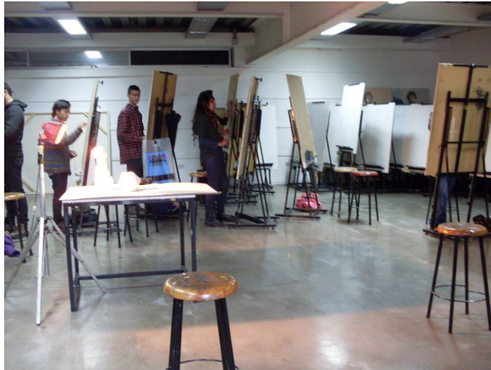
Clase de Dibujo 2, Achurado. UDP. 2013.