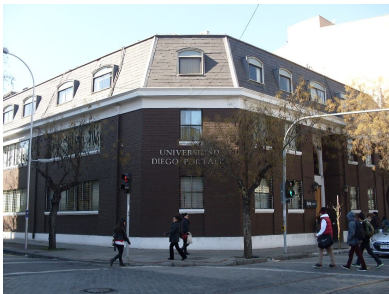
Universidad Diego Portales, Facultad de Educación.

Como parte del proceso en la FAAD, fue necesario homologar materias con similitud de contenido entre estas escogí: