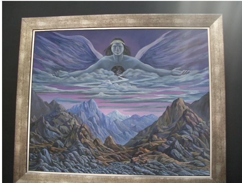
Óleo Sobre lienzo. Anónimo. MAC

óleo de distintos artistas dando alusión a la pachamama 6 , a los andes, a la vida, actividades que constantemente realizan, también con el centro de Cultura Gabriela Mistral. 7