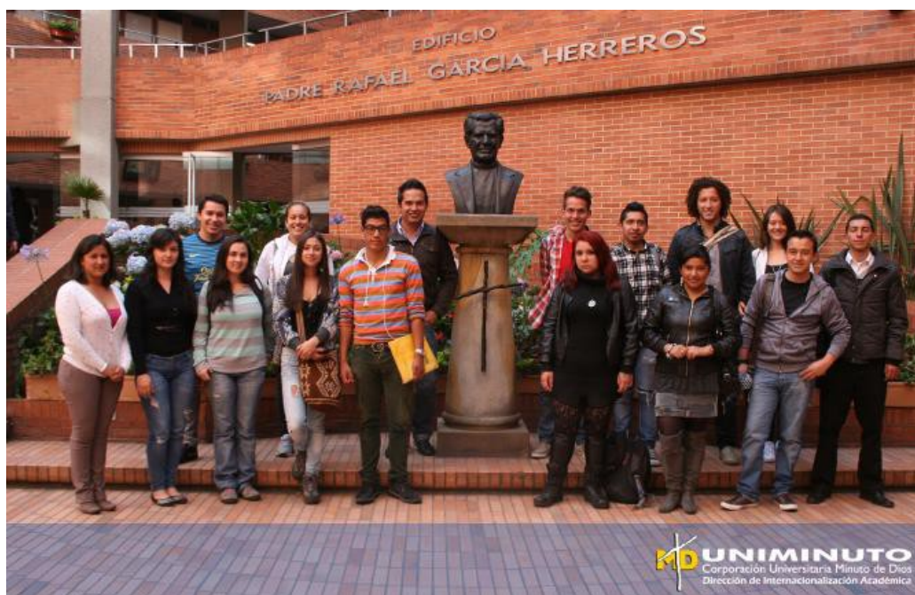
Grupo de Intercambio 2013 -2

académico, realizar práctica profesional, un curso académico corto o perfeccionar un idioma, para estar informado a cerca de estos procesos la información y convocatorias se pueden investigar actualizada mente en la página web http://www.uniminuto.edu/web/internacionalizacion/intercambio . Para realizar este proceso debe cumplir con ciertos requerimientos básicos, (promedio de 3,8, haber cursado en 70% de la carrera, y no tener retenciones con la institución y haber aprobado el curso transversal Catedra Minuto de Dios).