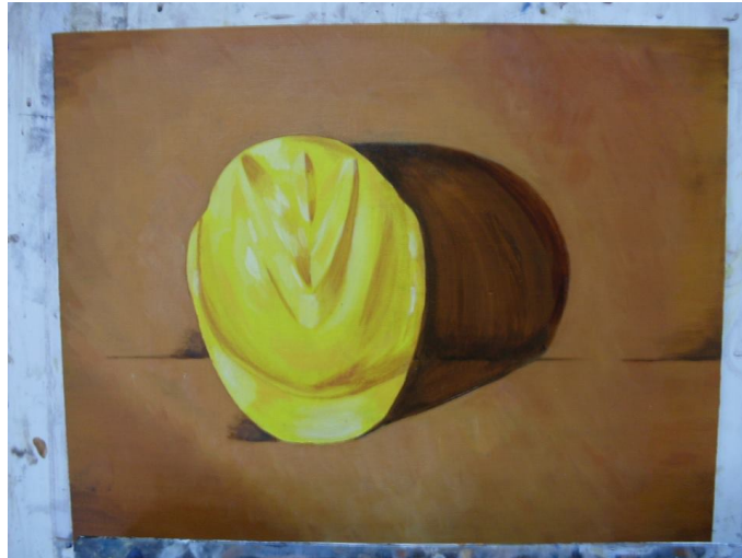
Acrílico sobre canvas, Fernanda Lozano. 2013. Clase pintura 2. UDP.