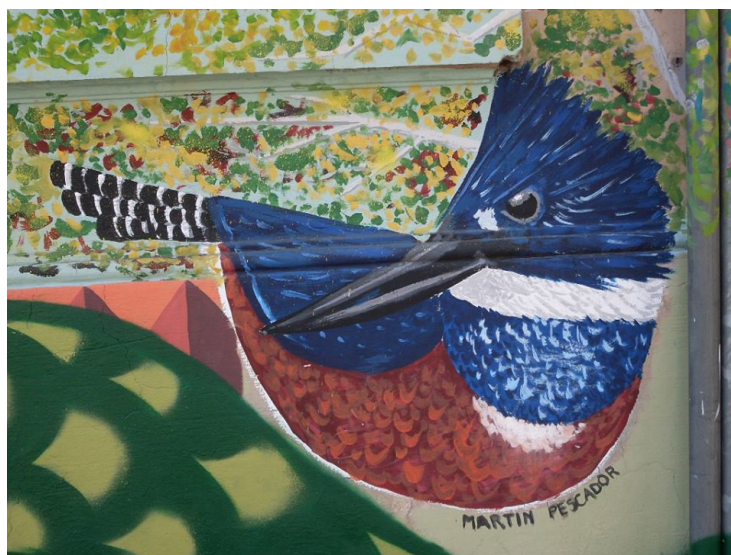
Martin pescador, anónimo.

El destino que elegí para este fin fue Chile, debido a varias razones a favor, primero posee la renta per cápita (media por persona en una estadística social determinada) más alta de Latinoamérica y pertenece a la categoría de países de Ingresos Altos según el banco mundial; por la velocidad de crecimiento cultural en los últimos años permitiendo la gran cantidad de extranjeros de los 5 continentes radicados allí que según el instituto Nacional de Estadísticas (INE) 1 de ese país se contabiliza alrededor de 441.000 siendo el 2,1 de la población Chilena en el 2014;. Y por tener la ciudad artística más bella de Suramérica, Valparaíso. Debido a la vistosidad de los murales estilo arte pop, arte óptico, figurativa y abstracta que recorren los 42 cerros de la ciudad y que nació en los años 60 por iniciativa del Profesor Francisco Menes como proyecto de mural a cielo abierto de la Universidad Católica.