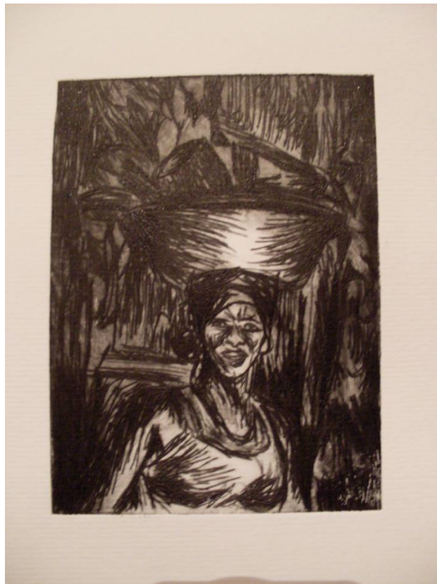
Grabado sobre papel canson, Fernanda Lozano. 2013 Clase Introducción a la gráfica. UDP