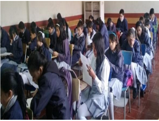
Figura # 1 Niños resolviendo una prueba. Morales (2013)

En consecuencia, vale la pena exponer la lectura como un ejercicio que permite “ comprender , y para comprender es necesario desarrollar varias destrezas mentales o procesos cognitivos, como: anticipar lo que dirá un escrito, aportar nuestros conocimientos previos, hacer hipótesis y verificarlas, elaborar inferencias, construir un significado (...)” Cassany (2006). Es decir, leer debe definirse (en el siglo XXI) como un proceso sociocultural que se construye y toma sentido cuando se fomenta un diálogo entre el lector, el libro y el autor. De este modo quien lee tiene la libertad de interrogar, opinar, abstraer y comprender múltiples mensajes que el texto conlleva. Y en este sentido es orientada la propuesta investigativa.