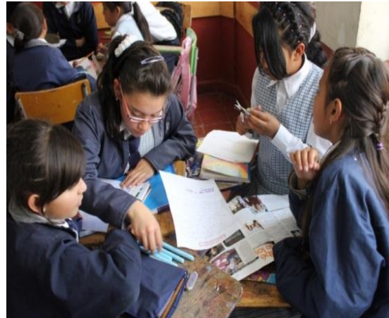
Figura #3 Niñas realizando periódico Mural. Morales (2013)

El estudiante debe tomar elementos que están en la noticia, para que pueda relacionarlos entre sí y realizar inferencias; al leer el título de la noticia y pensar que quiere decir, que piensas, que crees que encontraras en la noticia. Luego leer la noticia y comparar con lo que ha contestado se da cuenta que hay mucha relación entre lo que se infiere y la realidad.