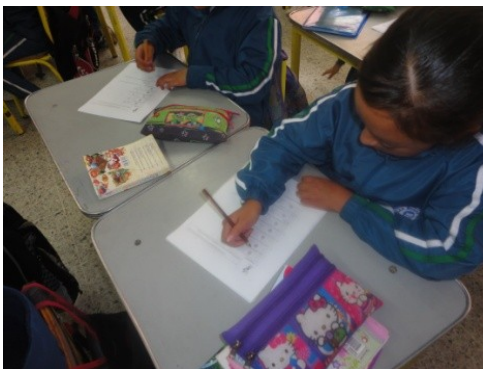
Figura 1: Aplicación de la prueba diagnóstica

pregunta abierta con relación a las estrategias que se implementan dentro del aula.