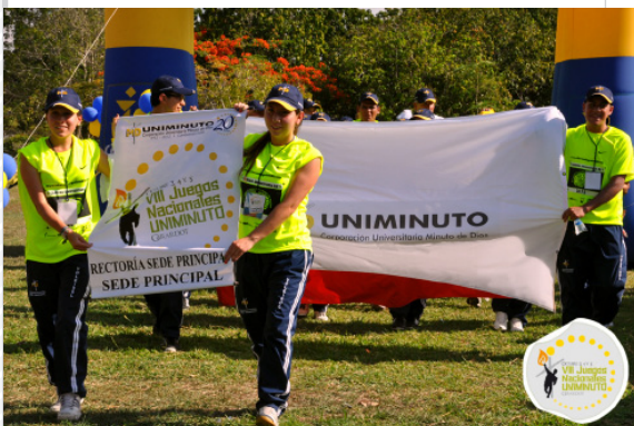
Dirección de Comunicaciones - UNIMINUTO.