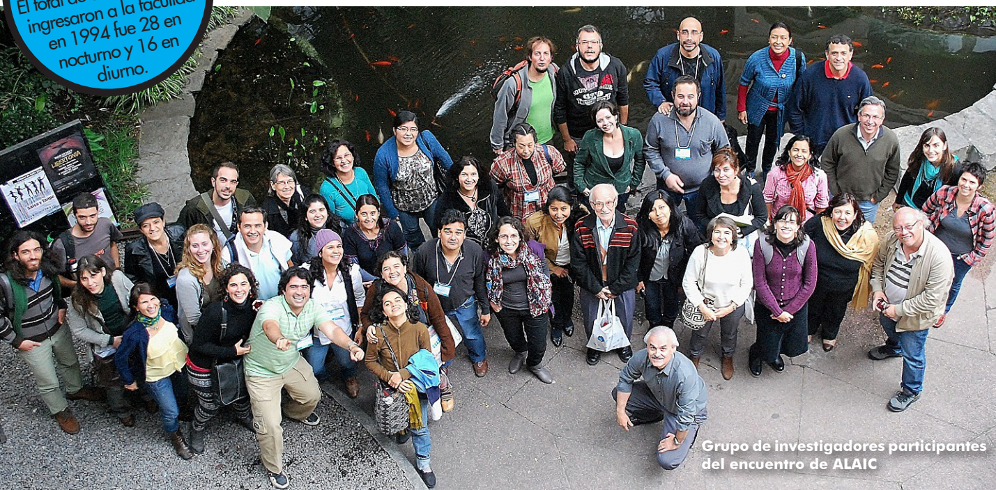
Grupo de investigadores participantes del encuentro de ALAIC

El total de estudiantes que ingresaron a la facultad en 1994 fue 28 en nocturno y 16 en diurno.