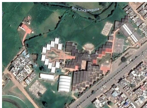
Foto satelital Escuela Normal Superior Sor y Guevara de Chiquinquirá Josefa del Castillo

Escuela Normal Superior Sor Josefa del Castillo y Guevara del Municipio de Chiquinquirá-Boyacá