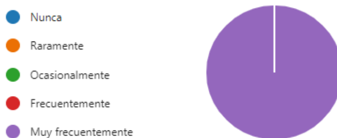
Ilustración 5. Percepción docente

Por otro lado, es de suma importancia entender el posicionamiento de los docentes, de cara al fortalecimiento e implementación de las estrategias no formales a través de la United Way, es por esto que, se indaga sobre la frecuencia en la que brindan a los docentes ideas para reflexionar sobre asuntos en los que antes no habían tenido incidencia, para lo cual, se encuentra que, muy frecuentemente se realiza ese tipo de ejercicios de cuestionamientos; esto permite también que, de cara a los docentes existan recomendaciones y acciones a favor de los estudiantes o beneficiarios para afrontar de manera mancomunada acciones para reducir la mitigación, así el o la joven podrá culminar su proceso académico, cualificadamente y competente una vez finalice su ciclo académico, dando fin a ciclos de pobreza, así como un acceso igualitario a formación técnica, profesional y superior de calidad.