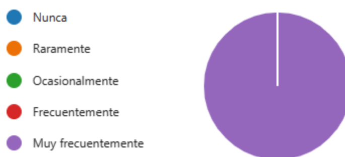
Ilustración 3. Reflexiones

Por otra parte se evidencia que para mitigar la deserción y lograr una transformación social perdurable en el tiempo, se requiere de un factor reflexivo importante por todos los actores educativos, en este caso a docentes y estudiantes el proceso que llevan a cabo las estrategias, los obliga a reflexionar sobre aspectos que ellos nunca han pensado antes y buscar una mejor solución, brindando con esto que se expandan las alternativas a las diferentes problemáticas en las que se enfrentan día a día.