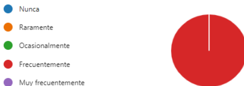
Ilustración 4. Diseño de actividades

Ahora bien, de acuerdo a la información analizada por parte de agentes de la United Way, la frecuencia con la que emplean espacios, elementos u otros elementos para el diseño de actividades es de manera frecuente.