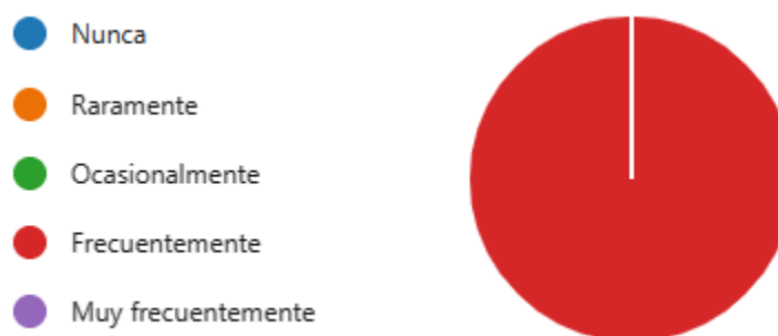
Ilustración 2. Interés estudiante

Con respecto a los estudiantes es importante mencionar que estos programas y las estrategias no tendrían sentido sin una escucha activa por parte de la organización para con ellos y sus preocupaciones, no solo porque comprenden las necesidades y con estas idear y crear nuevas soluciones, lo que facilita posteriormente evaluaciones a estas, sino que fomenta un ambiente de colaboración y empatía para reforzar el tejido social.