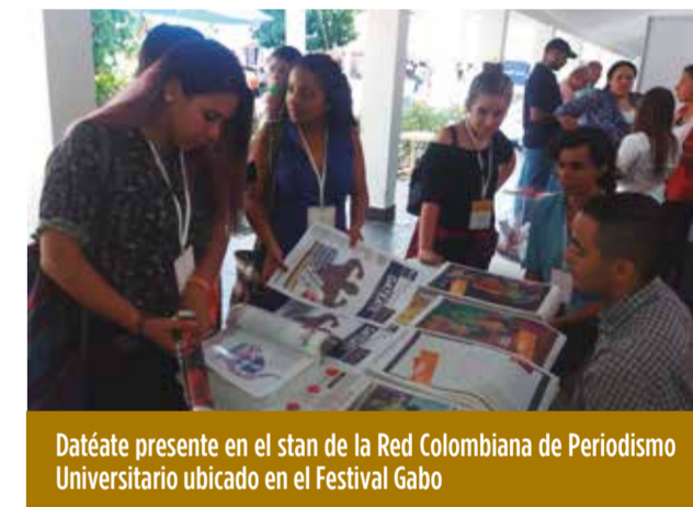
Dateate presente en el stan de la Red Colombiana de Periodismo Universitario ubicado en el Festival Gabo