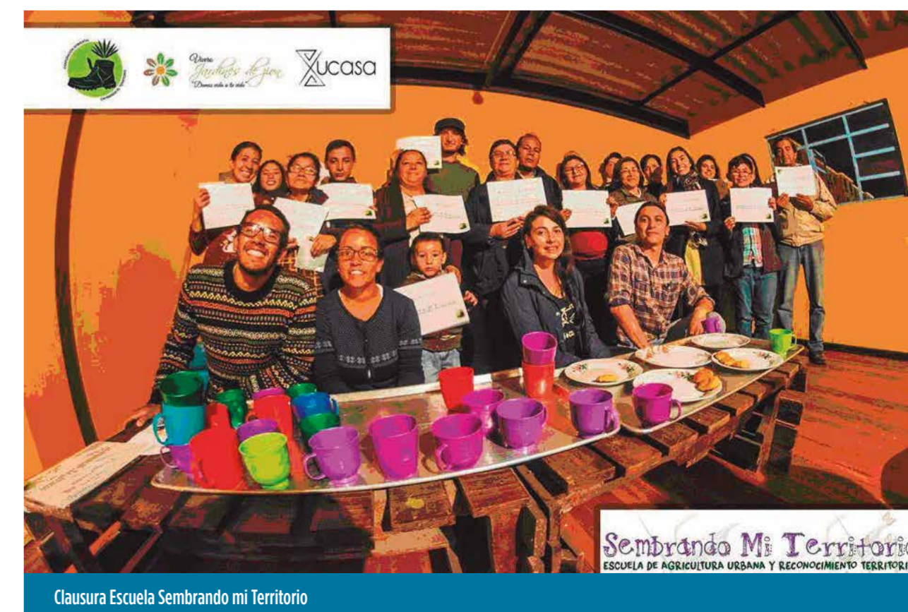
Clausura Escuela Sembrando mi Territorio