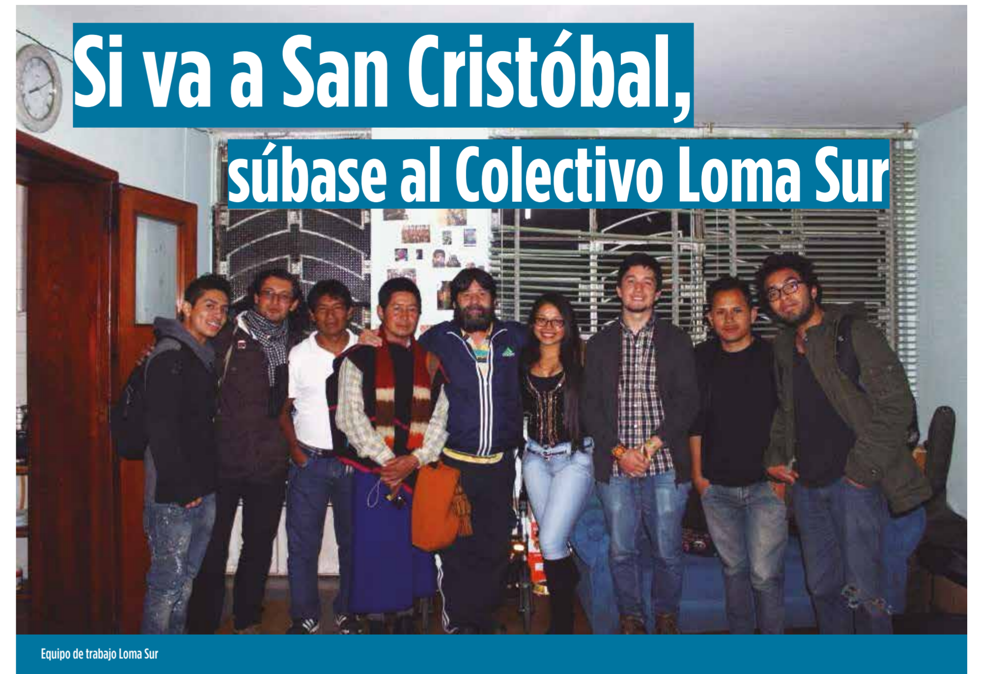
Equipo de trabajo Loma Sur