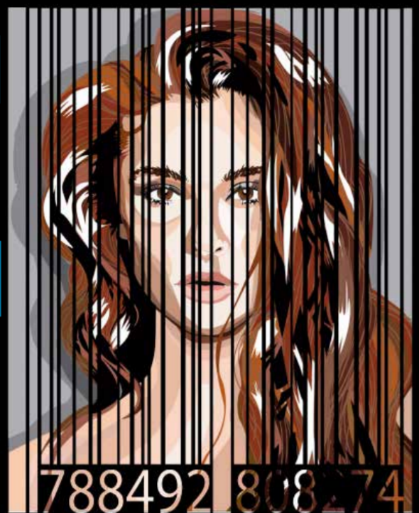
Ilustración de Andrés Murcia