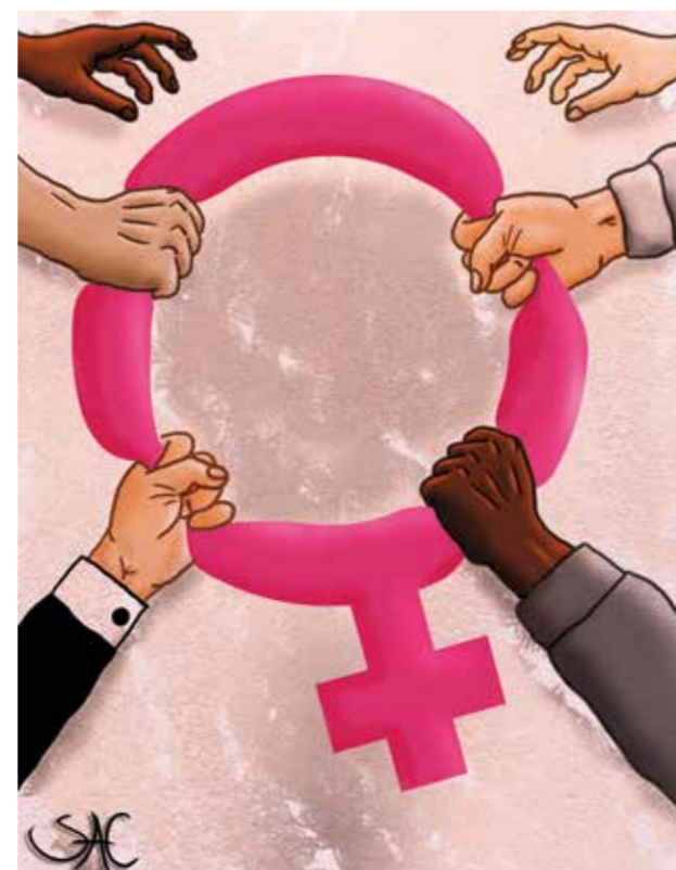
Ilustración de Johan Abril

Annie Sprinkle, artista y actriz porno, es considerada la precursora del postporno, un movimiento creado al calor del feminismo que quiere identificar el placer como un elemento fundamental de la liberación de las mujeres y cuestionar la capacidad del "Estado patriarcal" para garantizar su bienestar. Tomó fuerza de la mano del filósofo queer Paul B. Preciado, que organizó en 2003 el primer Maratón Postporno en el Museo de Arte Contemporáneo de Barcelona (MACBA). El objetivo de esta corriente es la reapropiación feminista y queer del porno para representar cuerpos y sexualidades no normativas que no están incluidas en la industria.