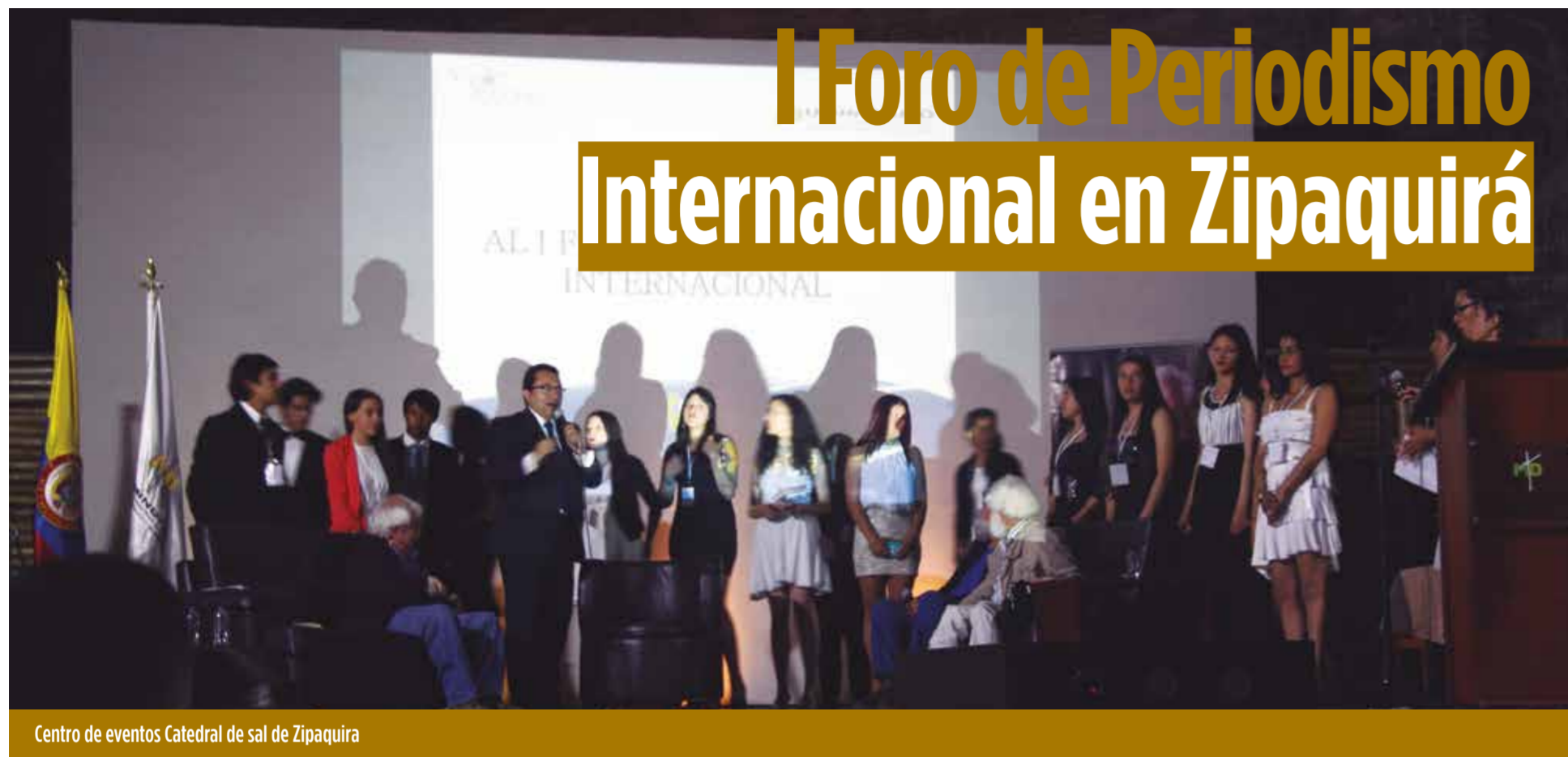
Centro de eventos Catedral de sal de Zipaquirá