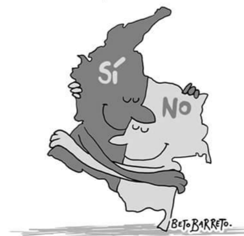
Así nos vemos mejor

Beto Barreto ha centrado su trabajo en temas históricos y coyunturales como por los que está atravesando en este momento Colombia. Decidió hacer una caricatura del Sí y el NO abrazándose, ya que “está en un momento de coyuntura importante, donde los del Sí están echándole la muela a los del NO y viceversa. No hay sentido que nos dividamos todos queremos lo mismo, la paz”.