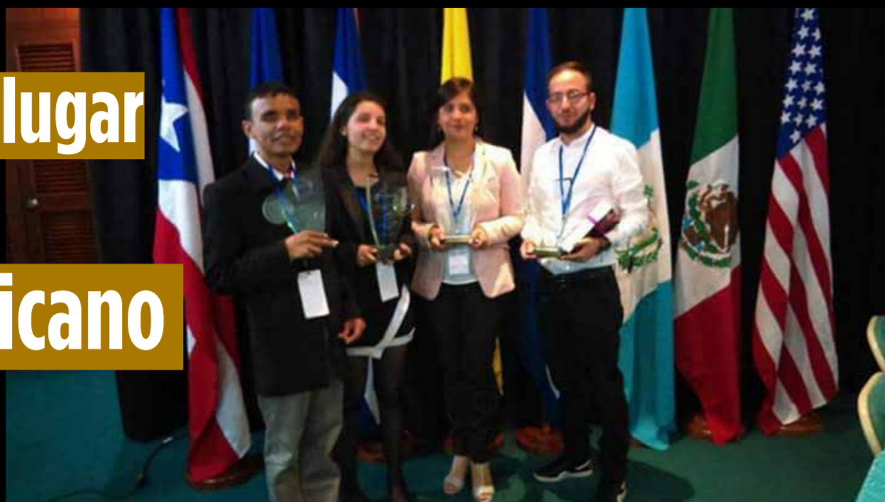
Equipo ganador del torneo