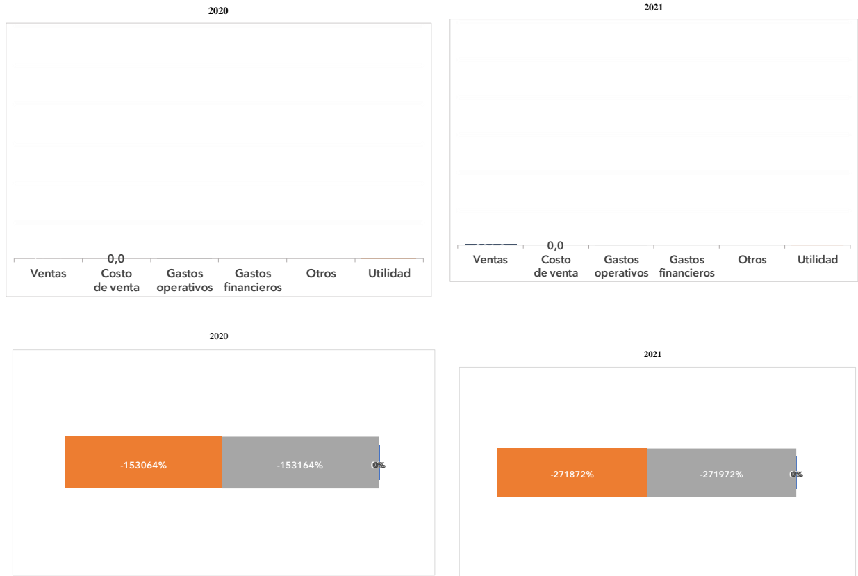
Figura 2. Comparativo Estado de Resultados Integral 2021,2020