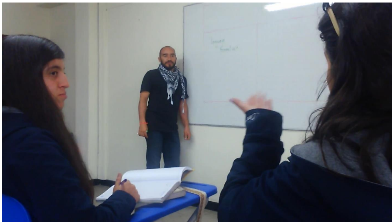
Figura 4: Muestra de clase tradicional fuera del ágora.