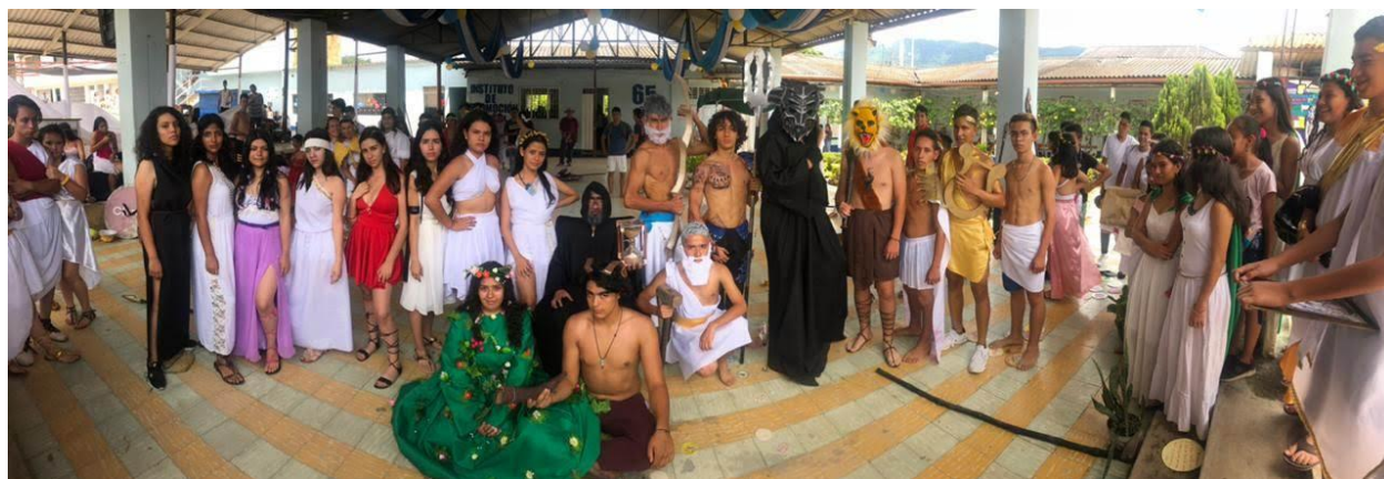
Figura 1: El INPS se volvió Grecia.