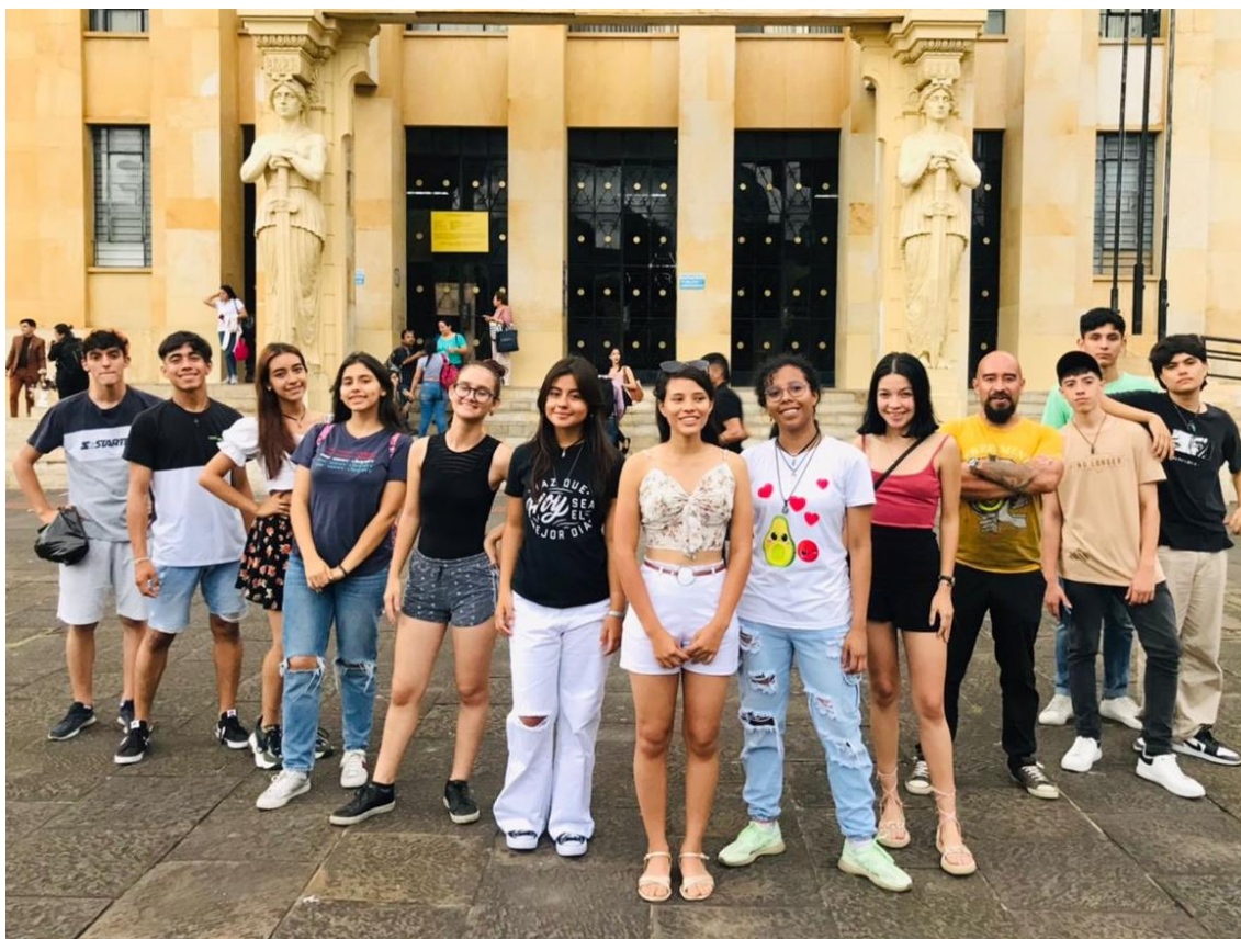
Figura 6: La experiencia del Ágora fuera del aula.