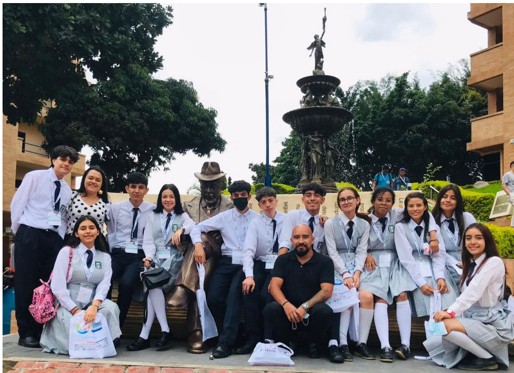
Figura 3: Participación en el III Congreso internacional de ética, ciencia y educación. Bucaramanga – Santander.