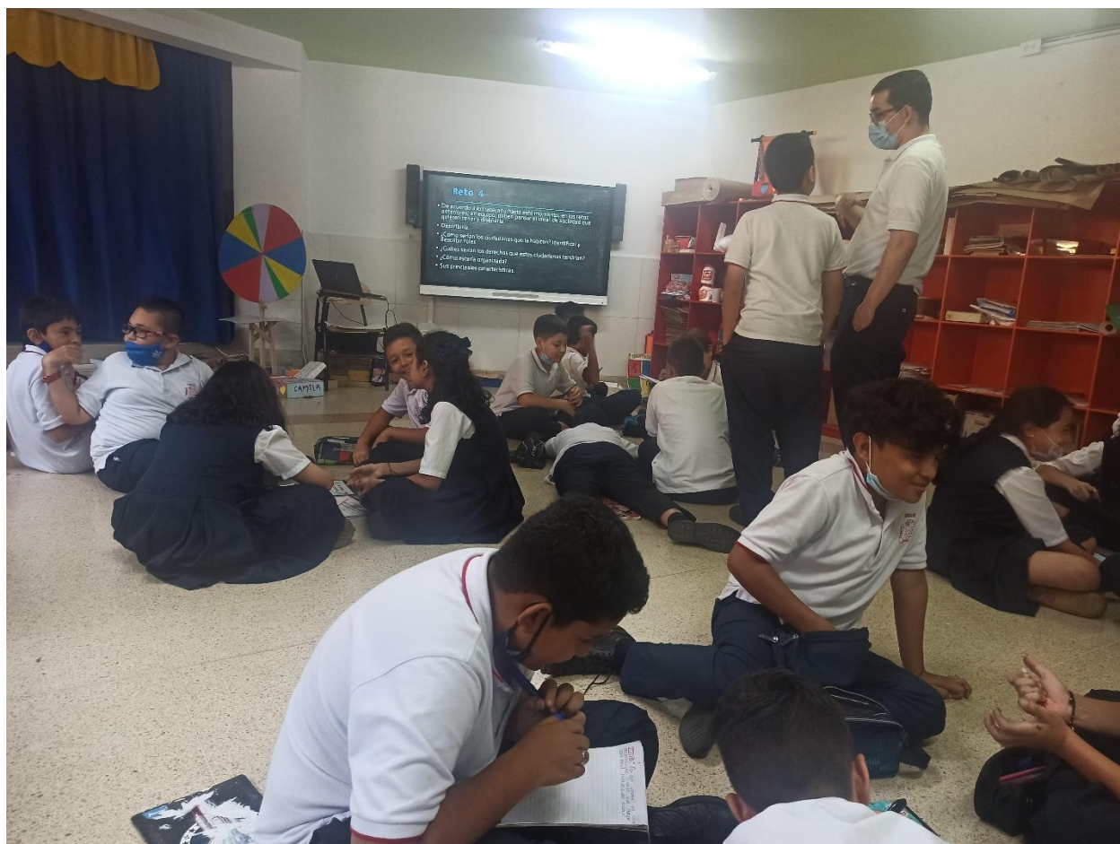
Figura 5: Experiencia filosofía para niños pasantía Colegio San Marcos- Envigado, Medellín