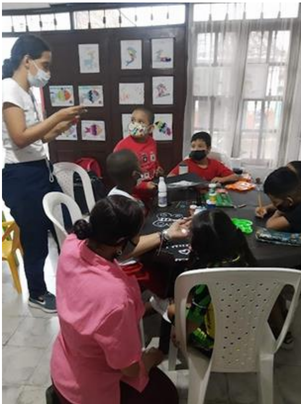
Expresión de interpretación de la música con pintura y sal.