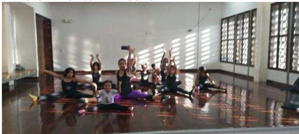
Inicio de las clases folclóricas, con exploración y conocimiento del cuerpo.