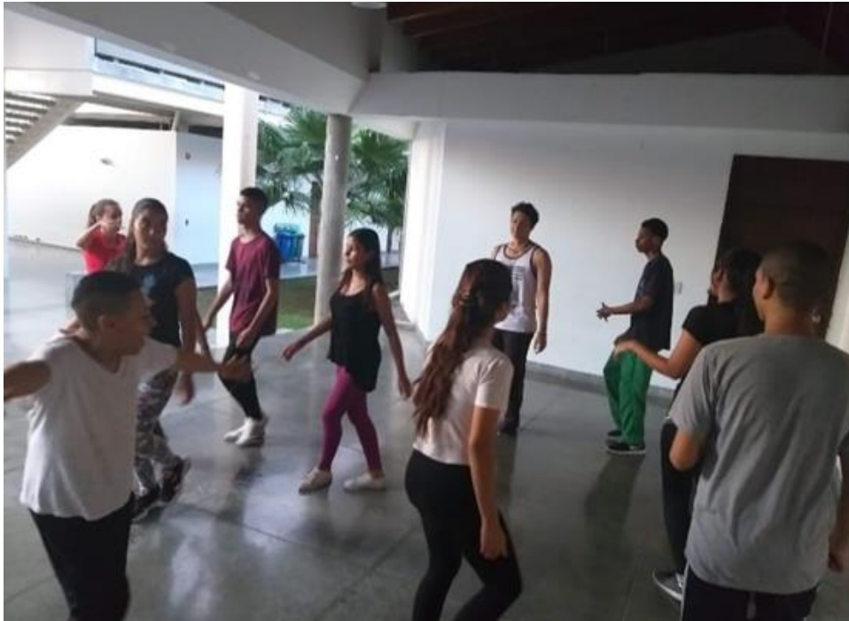
Ejercicios de desplazamiento por espacio y niveles.