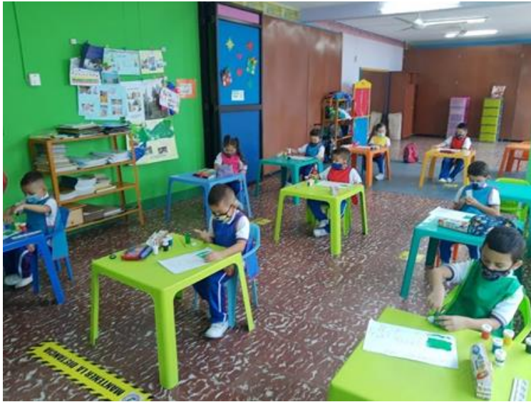
Expresión de interpretación de la música con pintura.