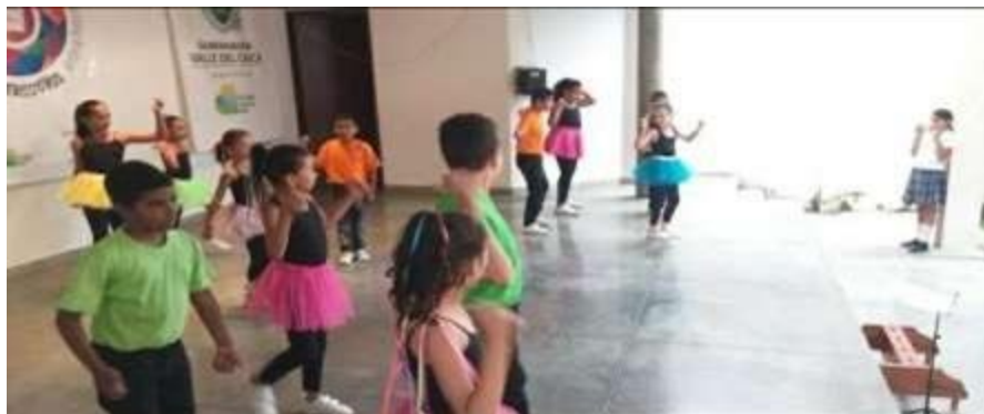
Presentación cierre periodo 2021-2