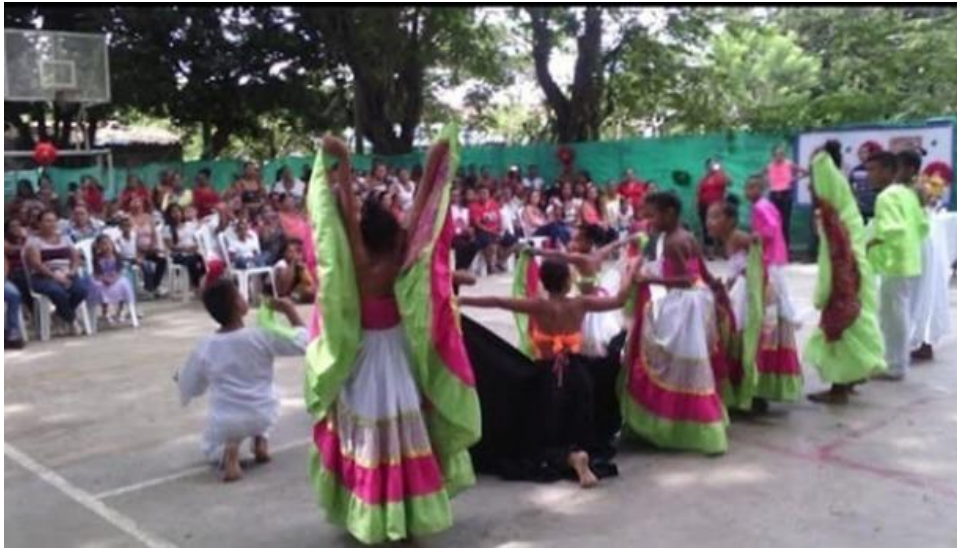
Presentación cierre Colegio Rural Guabas IE. José Celestino Mutis periodo 2022-1