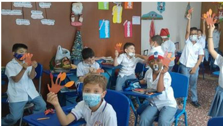
Elaboración de las máscaras.