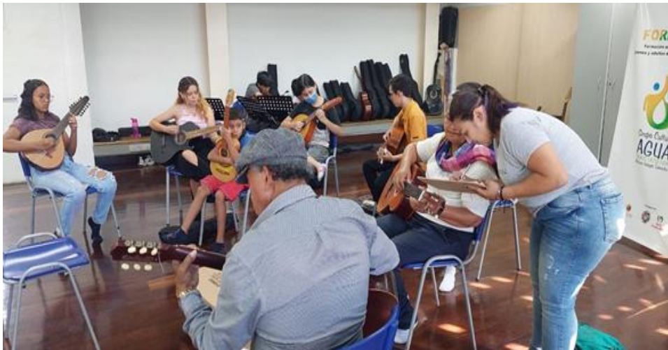
Sistematización de datos.