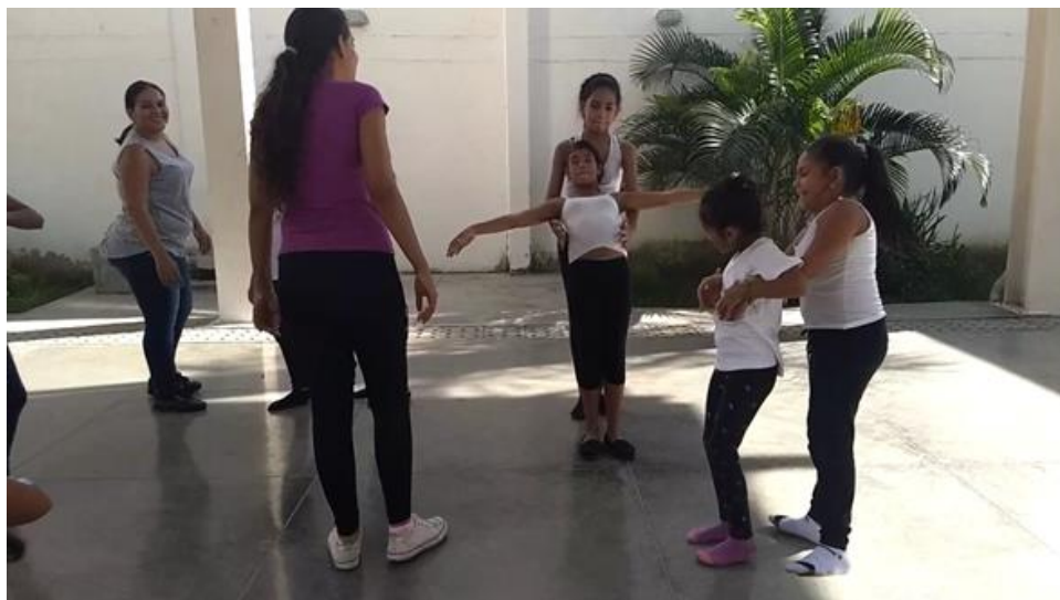
Ejercicio para aumentar la confianza entre los estudiantes y mejorar las relaciones interpersonales.