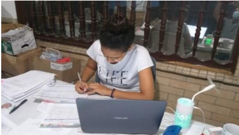
Realización de formatos para la sistematización.