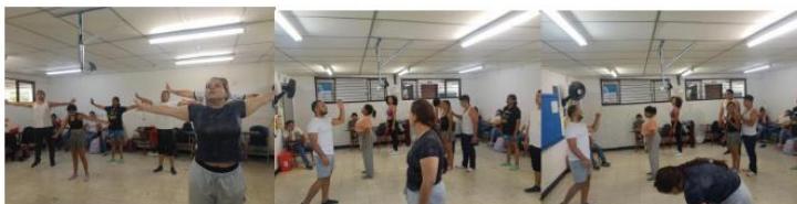
Imagen 2. Ejemplo de formato de diario de campo utilizado en la práctica pedagógica número tres.

Como propuesta pedagógica se plantea la clase a través de una investigación en la que se busca la construcción de la definición y a través de este conducir a los alumnos a un paralelo entre el reconocimiento de las habilidades del cuerpo y lo que realmente puedo lograr con él, así como la conciencia de hacer un ejercicios completo y responsable sobre su cuerpo, así como dándole herramientas dinámicas para la preparación de la clase dentro del aula de clase.