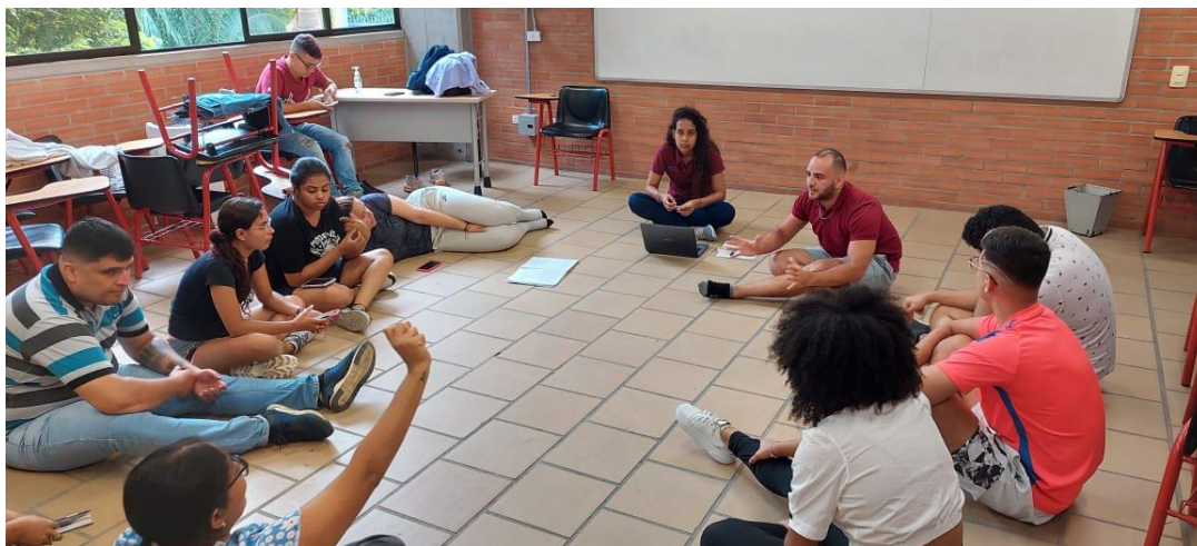
Imagen 5. Práctica pedagógica enfocada en la planimetría y planigrafía dentro de un montaje dancístico