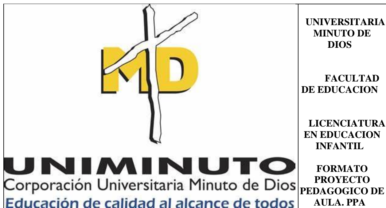
Tabla 7. Muestra PPA

A continuación, se presenta la propuesta del Proyecto Pedagógico de Aula: