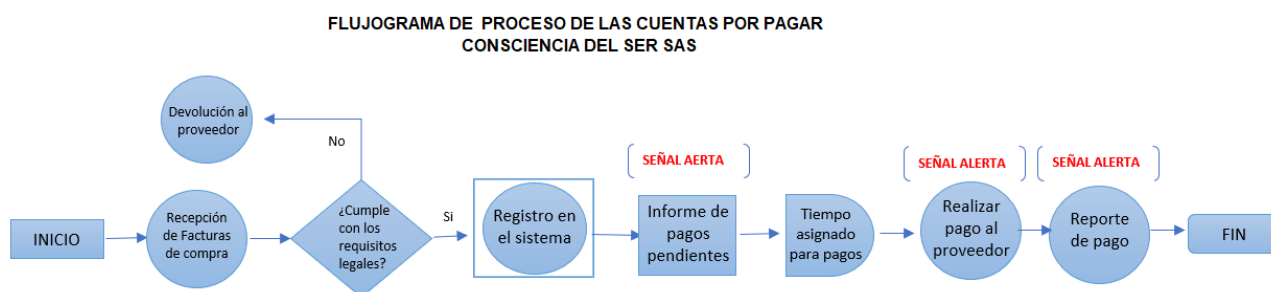
Figura 1. Flujograma del proceso de cuentas por pagar de la empresa Conciencia del Ser SAS

Con el fin de representar la secuencia de las actividades de proceso de pago de cuentas por pagar en la empresa Conciencia del Ser SAS, se creó el diagrama de flujo para visualizar de una manera clara y sencilla su funcionamiento, evidenciando claramente en que parte del proceso se deben generar señales de alerta donde se debe tener mayor control para el adecuado desarrollo de la actividad, el cual se adjunta a continuación: