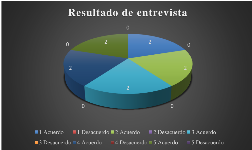
Gráfico 1: Resultado de entrevista.